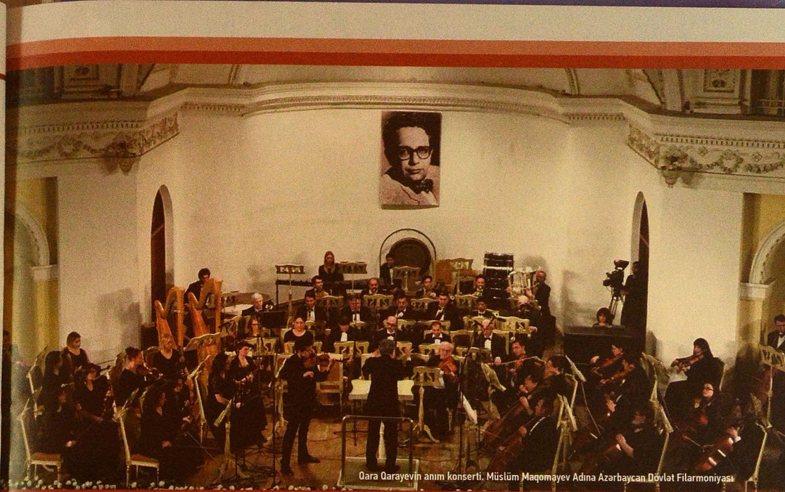
Qara Qarayevin anım konserti. Müslüm Maqomayev adına Azərbaycan Dövlət Filarmoniyası