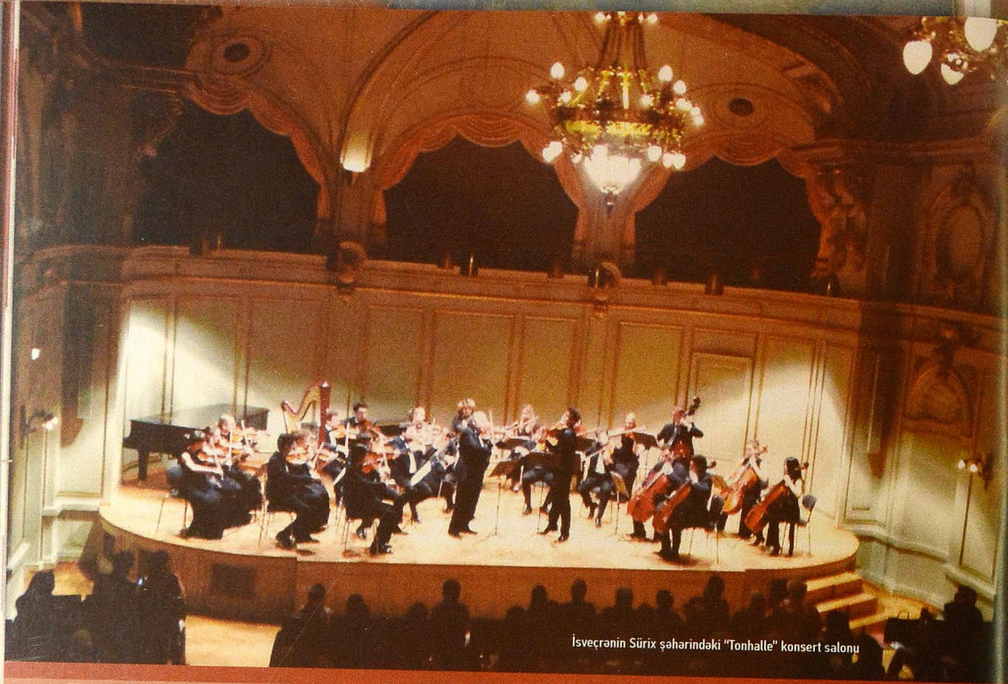
İsveçrənin Sürix şəhərindəki "Tonhalle" konsert salonu