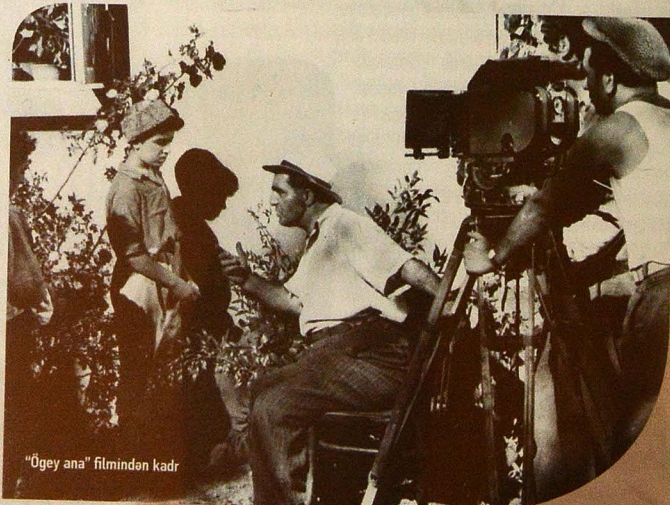
“Ügey ana” filmindən kadr