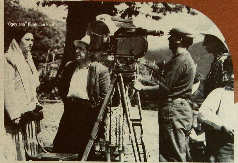
“Ügey ana” filmindən kadr

1962-ci ildə rejissor H.İsmayılın özünün ikinci böyük bədii filminə – yazıçı M.İbrahimovun eyniadlı romanının motivləri əsasında “Böyük dayaq” kinoromanına quruluş verir. Sosial dram janrında çəkilmiş bu filmin müəyyən zaman kəsiyində tariximizi, məişətimizi yaşadan kino əsəri olduğunu desək, səhv etmərik. Əsərdə olduğu kimi, filmə də ciddi siyasi, əxlaqi və tərbiyəvi problemlər qaldırılıb. Burada kənd təsərrüfatında gedən dəyişikliklərdən, müasir kəndimizin adamlarından, rəhbərlikdə demokratik üsulları bərpası uğrunda aparılan mübarizədən söhbət açılır.