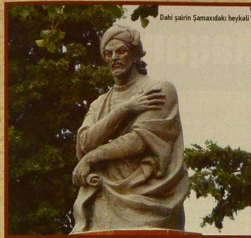
Dahi şairin Şamaxıdakı heykəli

Təxəllüsü ilə səyahətlərdə keçən ömrü bir həmahənglik yarıdan Nəsimi səhər mehi kimi bir yerdə qərar tuta bilməmişdir. Onun müxtəlif niyyətlər ilə üz tutduğu ölkə və şəhərlərin təqribi siyahısı belədir: Şiraz, İsfahan, Bursa, Bakı, İraq (o cümlədən Bağdad), Maraş, Anqara, Toqat, Əntap (İndiki Qaziantep) və nəhayət, sonuncu "duracaq yer"lərindən (Nəsimi) olan Hələb. (Şairin əsərində Kəməx qalasına poetik müraciəti onun Ərzincanda da olduğunu göstərir.) Burada onun Misir sultanı Şeyx əl-Müəyyəd (əl-Məlik əl-Müəyyəd Şeyx əl-Mahmudi) hiddətindən çəkinərək Hələbdən çıxması və Maraşda kürəkəni Nəsrəddin bəyin himayəsinə sığınmasını da xüsusi qeyd etməliyik. İndiyədək haqqında bəhs edilməmiş bu dalil nəsimişünaslıqda Nəsimi haqqında qaliblanmış düşüncələrin (onun Hələbə gəlişi zamanı tutulub edam olunması və ya ümumiyyətlə, Hələbdə həbsi) əsassızlığını göstərir. Misir sultanının israrı qarşı-