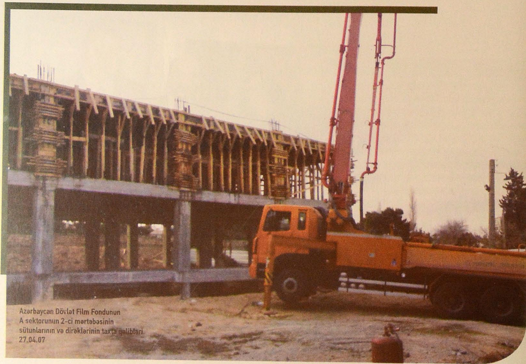
Azərbaycan Dövlət Film Fondunun A sektorünün 2-ci mərtəbəsinin sütunlarının və dirəklərinin taxta şalibləri. 27.04.07

Bu gün artıq müasir standart və tələblərə uyğun texnologiyaların quraşdırıldığı yeni bina var. Film Fondumuz 300 min saxlama vahidi həcmində film materiallarının yerləşdiyi məkan, müxtəlif temperatur rejimi və nisbi rütubəti qoruyan qurğularla təchiz edilmiş 18-film saxlama boksu, iki bərpəkarantın boksu, 108 nəfərlik kinozal, filmlərə baxış üçün kinozal və konfrans zalı, kimyəvi və foto laboratoriyalara malikdir. 7 mərtəbəli (zirzəmi və mansard da daxil olmaqla) binanın I və II mərtəbəsində inzibati, iş kabinetləri, filmlərin bərpası və montaj otaqları, əməliyyat otaqları və konfrans zalı yerləşir. Kinolentlərin təyinatına görə saxlanma temperaturlarına müvafiq şəkildə kameralarda temperaturlar -10°C-dən +12°C-dək dəyişir və bu atmosferi tənzimləmək üçün texnologiyaya uyğun qurğular quraşdırılıb. V mərtəbə isə müxtəlif təyinatlı iş otaqları kimi layihələndirilib.