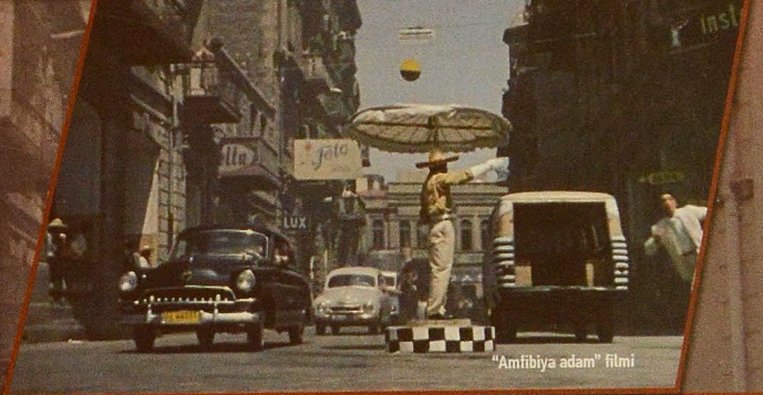
"Amfibiya adam" filmi