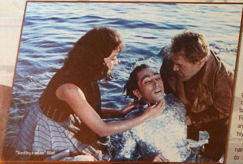
"Amfibiya adamı" filmi

Bu günə kimi Azərbaycan və paytaxt Bakı ümumilikdə 110-dan artıq xarici filmə lentə alınıb. "Mosfilm", "Lenfilm", "Qruziyafilm", "Taciqfilm", "Riqaqfilm" və digər ölkələr öz filmlərinin bir hissəsini Bakıda və Azərbaycanın digər dilbər guşələrində tarixin yaddaşına köçürmüşdür. Digər tərəfdən onu da qeyd etmək istərdim ki, həmçinin azərbaycanlı aktyor və rejissor heyəti də zaman-zaman kinoda digər ölkələrlə bir araya gəlib. Bakı həmişə keçmiş sovet məkanının tanınmış kinorejissorlarını maraqlandıırıb. Bura onlar üçün sirli, nağılları bir ölkə təəssüratı yaradıb. Həm də koloritli məkanları turistik təəssürat bağışladığı üçün bura daha əlverişli çəkiliş meydançası olub.