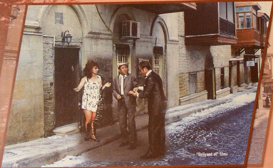
"Brilyant al" filmi