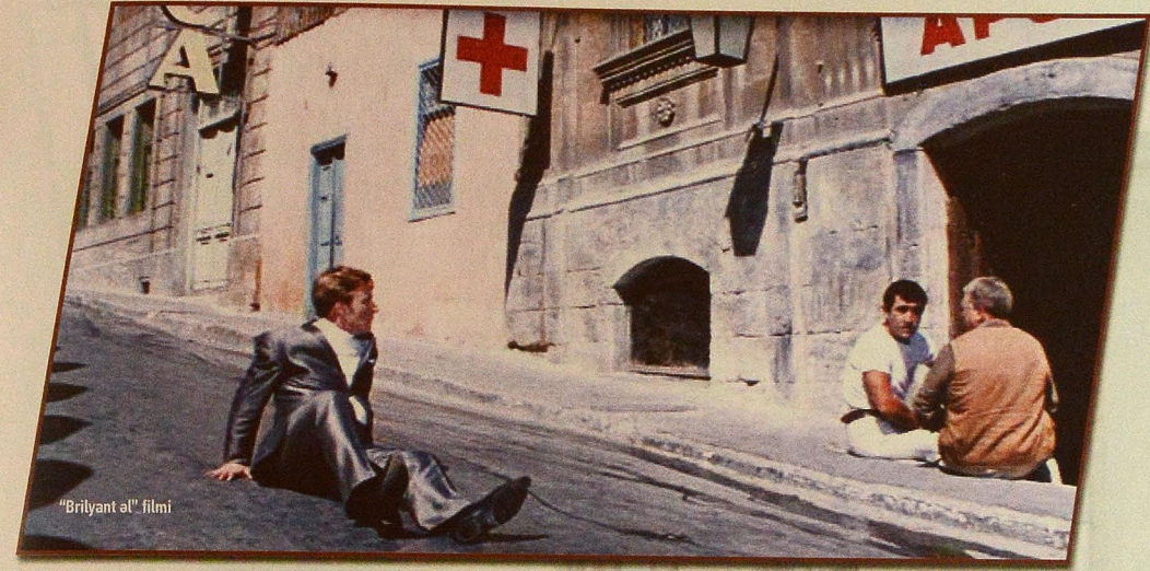
"Brilyant əl" filmi

Həmin dövrdə lentə alınan digər bir film bu gün də rusiyalı turistlərin ən çox