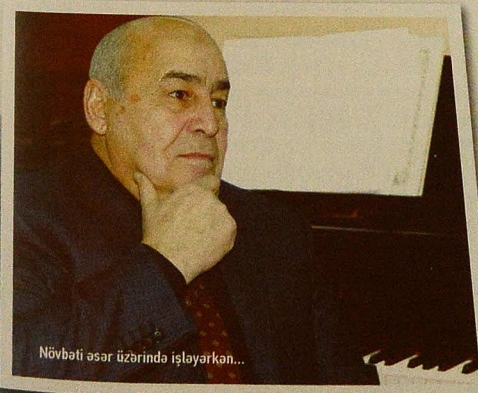
Növbəti əsər üzərində işləyərkən...

2009-cu ildə Azərbaycan Televiziya və Radio Verilişləri QSC-nin "Azərbaycantelefilm" yaradıcılıq birliyi bəstəkarın həyat və yaradıcılığı haqqında "Bəstəkar Oqtay Rəcəbov" adlı sənədli film çəkmişdir. Bun-