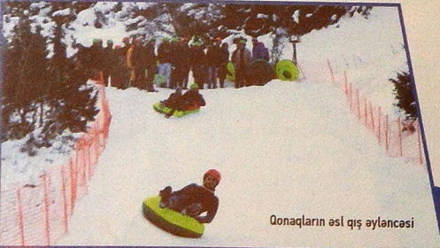
Qonaqların əsl qış əyləncəsi

Rayon mərkəzi bənzərsiz və səliqəli şəhərdir. Bir neçə il bundan əvvəl şəhərin mərkəzi hissəsində yerləşən və mədəniyyət abidəsi sayılan İçəriqaray saray kompleksində bərpə işləri aparılıb. İçəriqaray qala kompleksi XVIII əsrdə Qaxın mərkəzində salınmış qədim məhəllədir. Məhəllə onlarla kərpic evdən və iki qala divarından ibarətdir. Burada həmçinin açıq səma altında yerləşən 300 tamaşaçı tutumuna malik teatr, Nəsimi parkı və emalatxanalar yerləşir. XIX əsrin 80-ci illərində dahi bəstəkar və ictimai xadim Müslüm Maqomayevin atası usta