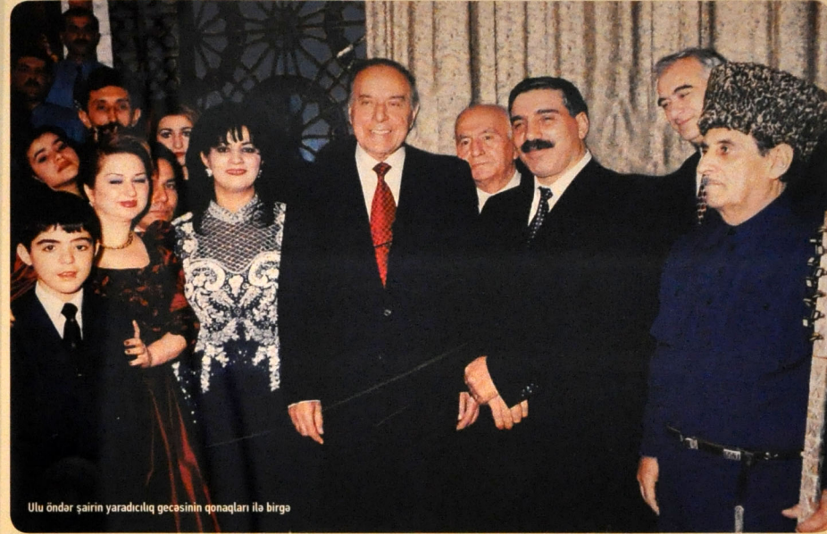
Ulu öndər şairin yaradıcılıq gəccəsinin qonaqları ilə birgə

Onun hərtərəfli yaradıcılığının əsas qayəsini təşkil edən vətən mövzusu həsrət zümzüməli iki çayın birləşməsindən yaranmış, əbədi hicran nəğməsi oxuyan dağların şahə qəlxədiği dəryaya bən-zəyir. Həmin qollardan biri Kərkükdən, Bayatdan, Urumçidən, Al-taylardan, Təbrizdən, Urmiyadan süzülərək keçdiyi yerlərdə torpaq, yurd, soydaş göynəyi əkə-bitirə-böyüdə uzun sənalərdir yol gəlir. Doğma anasından ayrı düşmüş zavallı çocuq isə səhildə çərasiz çir-pinir, oyan-buyana çəqir, taqətdən düşüb yeri qucaqlayır və qəriblik təşnəsindən cadar-cadar olmuş dodaqlarından son nida qopur: "Bəş