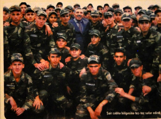
Sair cəbhə bölgəsinə tez-tez səfər edir

1950-ci il yanvarın 21-də Gürcüstanın Bolnisi rayonunun ərazisindəki qədim türk torpaqlarında – Kəpənəkçi kəndində bir çəğə döyüdü bu dünyanın qapısını. Dünya sazı-sözü, fikri-düşüncəsi, hörməti-şöhrəti ilə sonradan ona meydan oxuyacaq bu körpənə də hamı kimi qəbul elədi; onun içəri daxil olması üçün qapıları azca araladı. Zalimxan böyüdü, təhsil aldı, işə düzəldi, ailə-uşaq sahibi oldu – nəyi vardısı halal istedadı, zəhməti, dişi-dırnağı ilə qazandı. Həyatda çox çətinliklər çəkdi... nəhayət, bir gün təleyini tamamilə dəyişdirəcək bir şəxsiyyətlə – ulu öndər Heydər Əliyevlə qarşılaşdı... və ömrü boyu minnətdarlıq duyğuları ilə xatırladığı o İNSAN barədə "Əbədiyyət dastanı" poemasını yazdı: