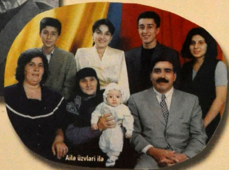
Ailə üzvləri ilə