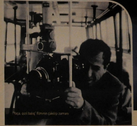
"Yaş, qızıl balıq" filminin çəkiliş zamanı