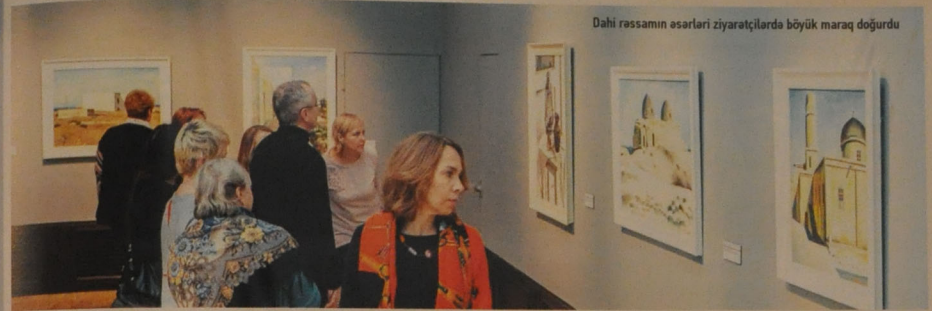
Dahi rəssamın əsərləri ziyarətçilərdə böyük marağ doğurdu

Martın 20-dək davam edəcək “Günəş zenitdə” sərgisi əslində Tahir Salahov irsinin təqdimatının yalnız bir mərhələsidir. Ötən il məşhur həmyerlimizin əsərləri Portuqaliyanın Lissabon şəhərində Madaniyyət və Turizm Nazirliyinin dəstəyi ilə keçirilən, 30-dan çox ölkənin rəssamlarının qatıldığı “Ənənə və müasirlik” Beynəlxalq İncəsənət Festivalında Azərbaycan ekspozisiyası adı altında sərgilənib.