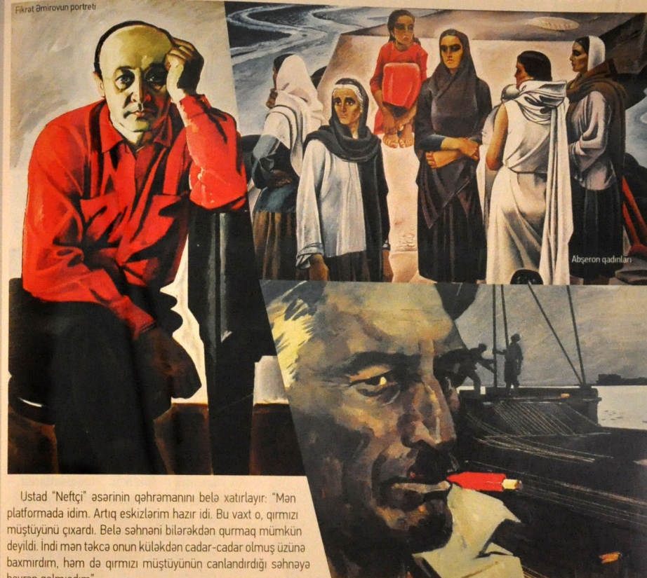
Fikrat Əmirovun portreti