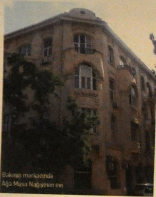
Bakının mərkəzində Ağa Musa Nağıyevin evi