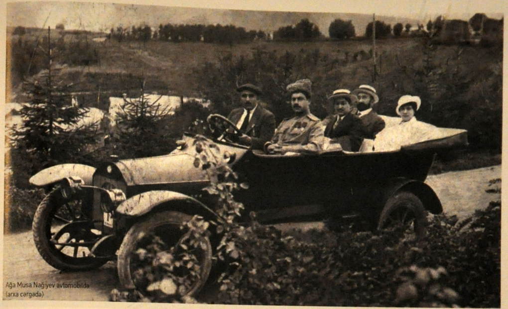
Ağa Musa Nağıyev avtomobilində (arxa cərgədə)

masa müayyən hissəsinə sahib çıxmaq. Əgər buna hüquqi yolla nail ola bilsək, ilk növbədə əlavə iki bina tikdirib Ağa Musanın vəsiyyətini yerinə yetirəcəyik. Ağa sağlığında Bakıda 98 bina inşa etdirmişdi. O vəfat edəndə deyib ki, "100 ev tikdirdim, yüz il yaşayardım". Həm də çalışırıq ki, küçələrin birinə Bakı üçün bu qədər iş gören xeyriyyəçi Ağa Musa Nağıyevin adı verilsin, "İsmailiyyə" binasının divarına onun xatirə lövhəsi vurulsun. Sonralar Ağanın sayagəlməz buruqları, 49 gəmisini, zavodları, fabrikləri olub. Özünün hasil etdiyi neftdən əlavə, bütün Bakı milyonçularının nefti onun Qaraxərdəki neftayırma zavodunda emal olunub.