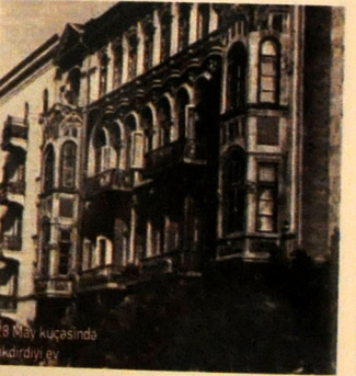
28 May küçəsində tikdirdiyi ev