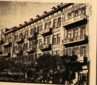
Nizami küçəsində tikdirdiyi ev