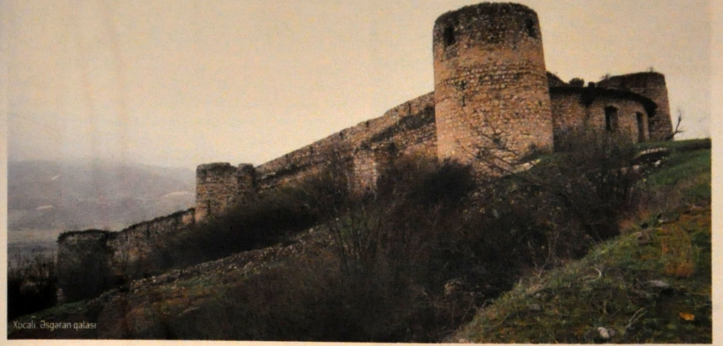
Xocalı. Əsgəran qalası

etdirilmiş XVIII əsrə məxsus Şahbulaq qalası da işğalçılar tərəfindən tacavüzə uğramış, ilkin görünüşü dəyişdirilmişdir.