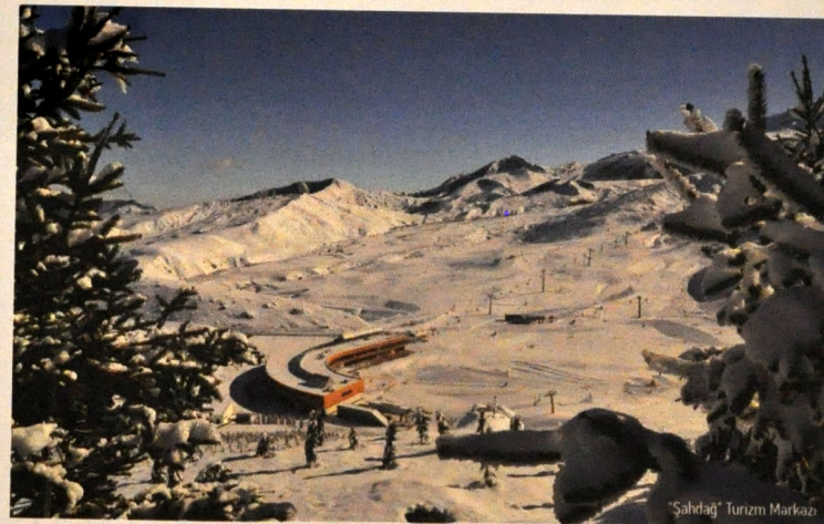
"Şahdağ" Turizm Mərkəzi

Bundan əlavə, ölkəmizdə turizm üzrə peşə təhsilli kadrlara da tələbat çoxdur. Ehtiyacı ödəmək məqsədilə Nazirlər Kabinetinin qərarı ilə 2012-ci ildə Azərbaycan Turizm və Menecment Universitetinin nazdında Bakı Turizm Peşə Məktəbi yaradılıb. 12 ixtisas üzrə hər il təxminən 500 şagird qəbul edən BTM-dən bu gündə 845 nəfər məzun olub.