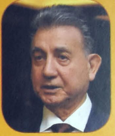
Akif Əlizadə, AMEA-nın prezidenti, akademik