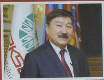
Düsen Kaseinov səs çoxluğu ilə yenidən TÜRKSOY-un baş katibi seçildi

Qazaxistanın Türküstan şəhərində keçirilən TÜRKSOY-un mədəniyyət nazirləri Daimi Şurasının 35-ci toplantısında ölkəmiz və bütün türk dünyası üçün əlamətdar qərarlar qəbul olunub.