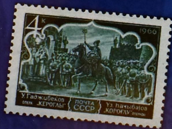
“Koroğlu” operasına həsr olunmuş SSRİ poçt markası (1966)