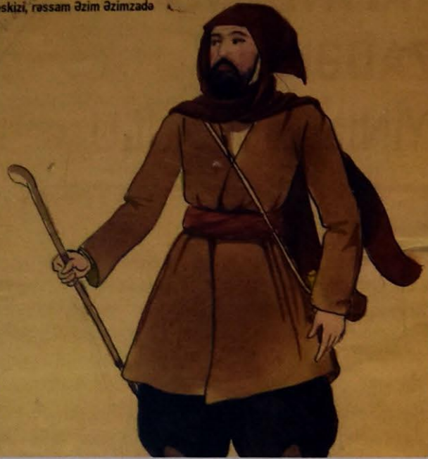
"Şeyx Sənan" tamaşası (1932) üçün Şeyx Sənanın geyim eskizi, rəssam Əzim Əzimzadə

tərtibatında da rəssam maili xətt üzərində yerləşdirilmiş dairəvi qurğudan istifadə edərək, özünəməxsus quruluş hazırlamışdı. Dairə fırladıqca səhnədəkilər də maili xətt üzrə qaçırdılar. Beləliklə, belə bir təsəvvür yaranırdı ki, Şeyx Sənanla Xumarı təqib edən dəstə onlarla bərabər dağın ətrafında fırlanaraq zirvəyə can atır. Digər səhnələrdə də rəssam konkretliyə, yığcamlığa yer verib. Şeyxlərin iştirak etdiyi səhnə Şərq üslubuna uyğun tağlarla tərtiblənməmişdi.