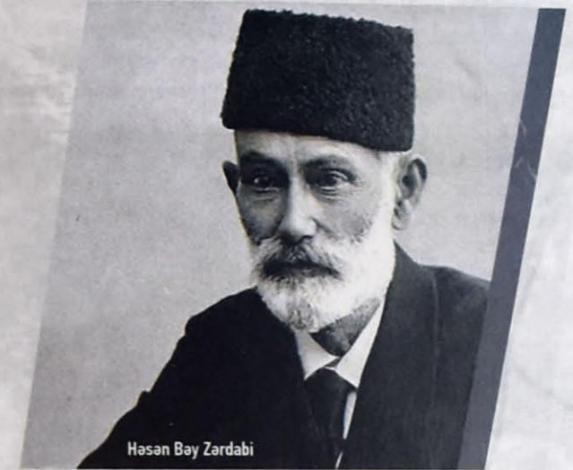
Həsən Bəy Zərdabi

1881-ci ildən fəaliyyətə başlayan, Azərbaycan tarixində yeni ruhlu mətbuat orqanı olan “Kaspi” qəzeti xalqın milli intibah və istiqlal hərəkatında böyük rol oynadı. 1897-ci ilin sonlarından “Kaspi” mətbəəsinin H.Z.Tağıyev tərəfindən 57 min rubla satın alınmasında, hətta nəşirliyi öz üzərinə götürməsində Ə.Topçubaşovun qayınatası, böyük maarifçi ideoloq H.Zərdabinin məsləhəti tarixi əhəmiyyətə çevrildi.