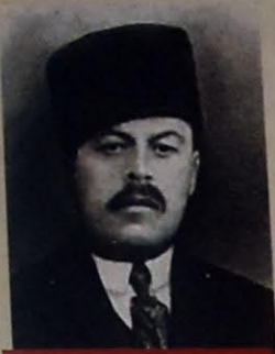
XUDADAD BƏY RƏFİBƏYLİ - SƏHIYYƏ NAZIRI, ÜMURİ-NAFİƏ VƏ KEYRİYYƏ (SOSIAL TƏMİNAT) NAZIRI