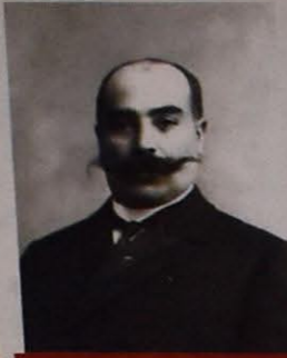
İSMAYIL XAN ZİYADXANOV - HƏRBİ İŞLƏR MÜVƏKKİLİ