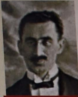
MUSA BƏY RƏFIYEV - PORTFELSİZ NAZIR, MƏZAHİB VƏ MÜAVİNƏ ((MƏZHƏBLƏR VƏ SOSIAL TƏMİNAT) NAZIRI, SƏHIYYƏ NAZIRI