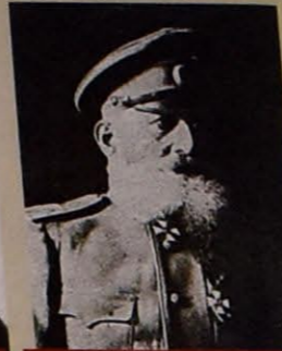
SƏMƏD AĞA MEHMANDAROV - HƏRBİYYƏ NAZIRI