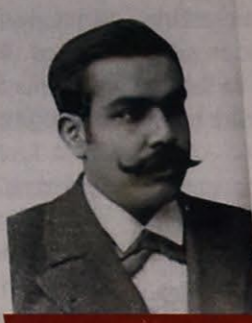
MİRZƏ ƏSƏDULLAYEV - TİCARƏT VƏ SƏNAYE NAZİRİ