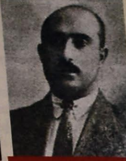
AĞA ƏMİNOV - TİCARƏT VƏ SƏNAYE NAZİRİ