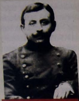
RÜSTƏM XAN XÖYSKİ - SOSIAL TƏMİNAT NAZİRİ