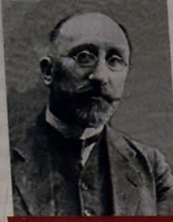
YEVSEY GİNDES - SƏHIYYƏ NAZİRİ