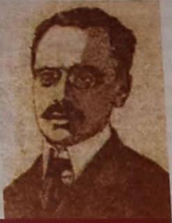
VİKTOR KLENEVSKI - ÖMÜRİ-KEYRİYYƏ (SOSIAL MÜDAFİƏ) NAZIRI