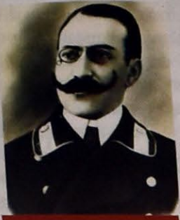
HƏMİD BƏY ŞAHTAXTİNSKI - MAARİF VƏ MƏZAHİB (MƏZHƏBLƏR) NAZIRI