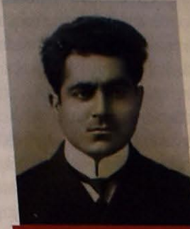
NURMƏHƏMMƏD BƏY ŞAHSUVAROV -MAARİF VƏ MƏZAHİB (MƏZHƏBLƏR) NAZIRI