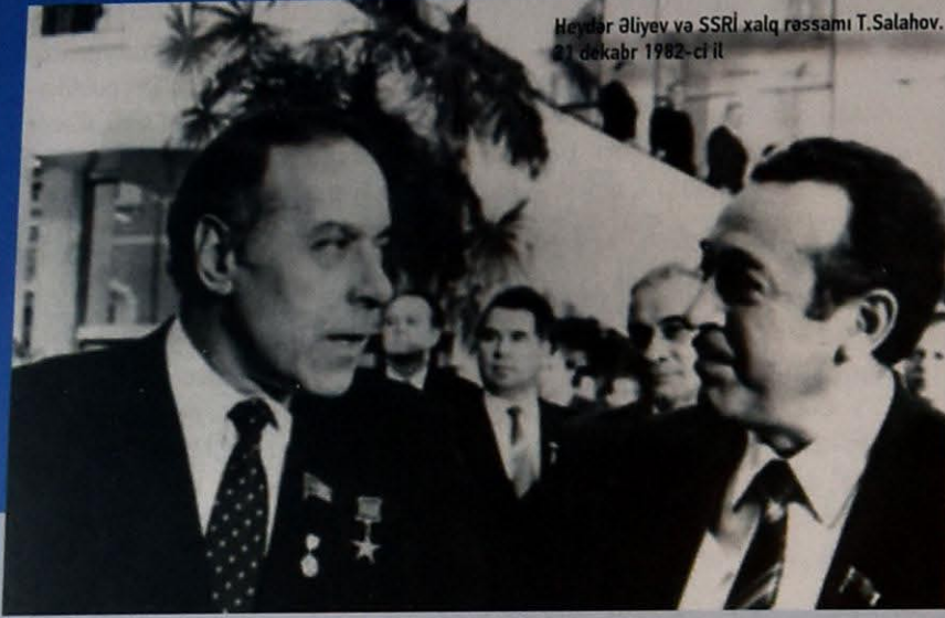
Heydər Əliyev və SSRİ xalq rəssamı T.Salahov. 21 dekabr 1982-ci il

yerinə yetirilməsini təmin etmək məqsədi ilə Azərbaycan SSR Ali Sovetinin 21 iyul 1978-ci il tarixli sessiyasında "Tarix və mədəniyyət abidələrinin mühafizəsi və onlardan istifadə haqqında Azərbaycan SSR Qanunu" nun qəbuluna, 27 yanvar 1982-ci ildə isə Azərbaycan Tarix və Mədəniyyət Abidələrinin Mühafizəsi Cəmiyyətinin Nizamnaməsinin Azərbaycan SSR Nazirlər Sovetində təsdiqlənməsinə nail oldu. Beləliklə, ölkə ərazisindəki tarix və mədəniyyət abidələrinin bərpası, tədqiqi və qorunması məsələsi qanun və qərarlarla rəsmiləşdirildi.