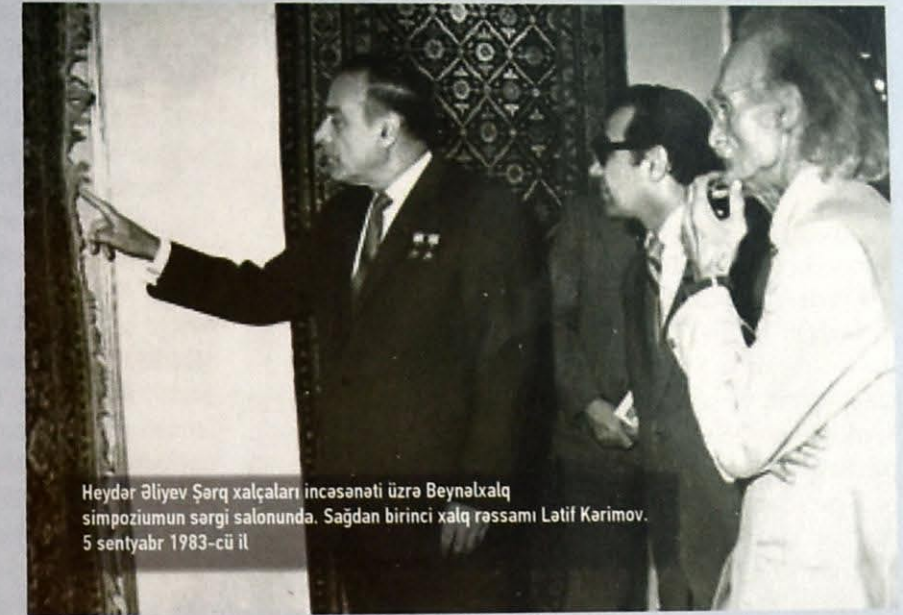
Heydər Əliyev Şərq xalqaları incəsənəti üzrə Beynəlxalq simpoziumun sərgi salonunda. Sağdan birinci xalq rəssamı Lətif Kərimov. 5 sentyabr 1983-cü il

"Sənətdə hər kəsin öz yeri var. Heç kəs kiminsə yerini almır",