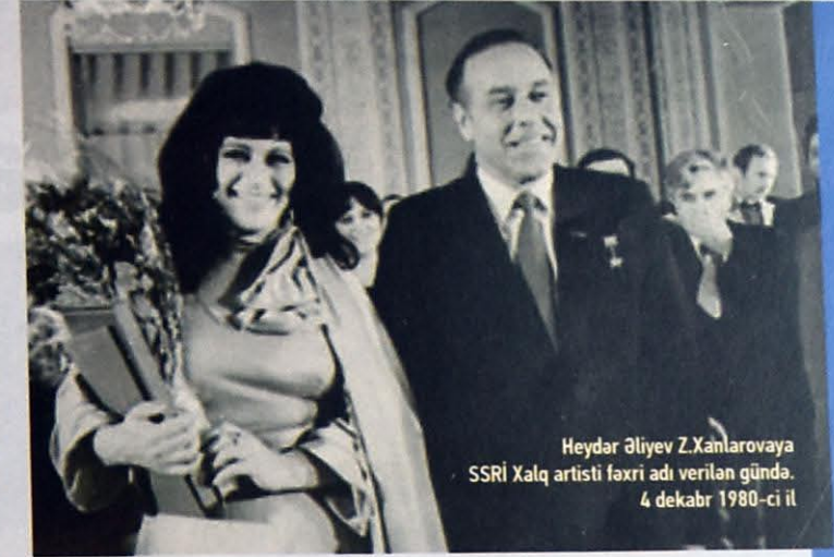
Heydər Əliyev Z. Xanlarovaya SSRİ Xalq artisti fəxri adı verilən gündə. 4 dekabr 1980-ci il

təməl prinsipi idi. Buna görə də xalqa milli-mənavi dəyərlərini aşılamaq üçün ilk növbədə öz dilini qorumağın, inkişaf etdirməyin vacibliyini yaxşı bilirdi. Eyni zamanda, xatırlamaq yerinə düşər ki, Ulu öndər o dövrdə bütün rəsmi nitqlərini Azərbaycan dilində edir, bunu bütün rəhbər vəzifəliyə də tövsiyə buyururdu. Başqa bir fakt. 1978-ci ildə Azərbaycan SSR-in Konstitusiyaya layihəsi qəbul edilərkən Azərbaycan dilinin ana dili kimi təsbitlənməsi də Heydər Əliyevin cəsarətinin, Azərbaycan dilinə qəlbən bağlılığının, sevgisinin əyani təzahürü idi... Bundan başqa, dahi öndərimizin ötən əsrin 70-ci illərində nəşr olunmuş 3 cildlik "Müasir Azərbaycan dili" dərsliyinə dövlət mükafatı verməsi də dediklərimizə bariz nümunədir. "Millətin milliliyini saxlayan onun dilidir. Şübhəsiz ki, musiqi də, ədəbiyyat da, ayrı-ayrı tarixi abidələr də millətin milliliyini təsdiq edir. Amma millətin milliliyini ən birinci təsdiq edən onun dilidir. Əgər Azərbaycan dili olmasa, Azərbaycan dilində mahnılar olmaz, musiqi olmaz. Bunların hamısı biri-birinə bağlıdır. Azərbaycan