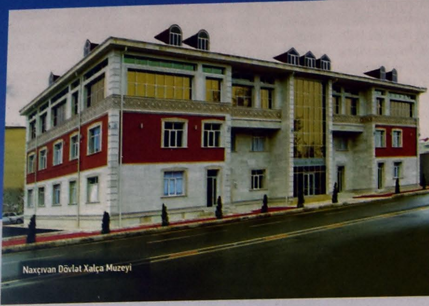
Naxçıvan Dövlət Xalça Muzeyi

Ulu öndər Azərbaycana rəhbərlik etdiyi bütün dövrlərdə mədəniyyətin bir çox sahələri kimi, kino sənətinin inkişafına da böyük qayğı göstərmişdir. 1976-cı ildə milli kinomuzun 60 illik yubileyi ilə əlaqədar kino işçilərinin böyük qrupuna fəxri adlar vermiş, ayrı-ayrı dövrlərdə "Azərbaycanfilm" in texniki bazasının möhkəmləndirilməsi, kinostudiya üçün yeni avadanlığın alınması üçün vəsait ayırmışdır.