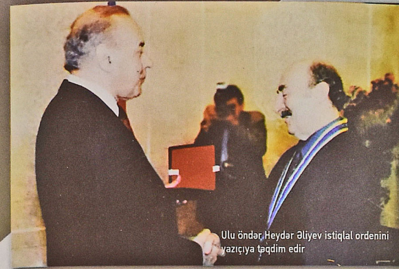
Ulu öndər Heydər Əliyev istiqlal ordenini yazıçıya təqdim edir

- Təqiblərin şaha qalxdığı vaxtlarda ya hələ dünyaya gəlməmişdim,