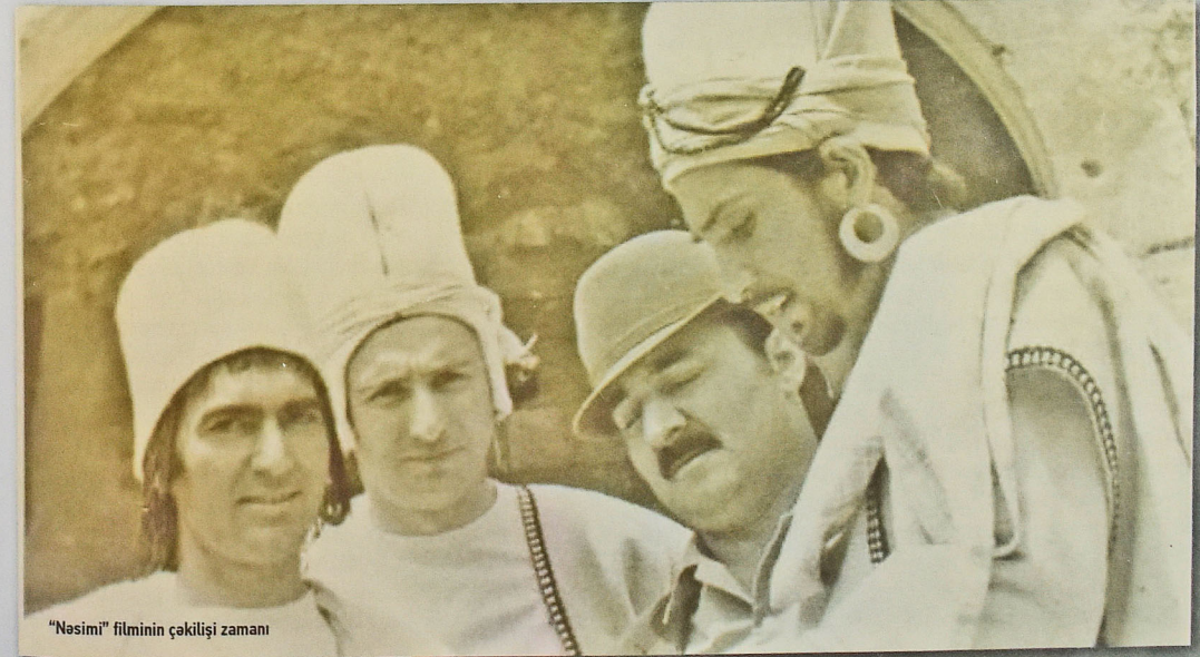
"Nəsimi" filminin çəkilişi zamanı