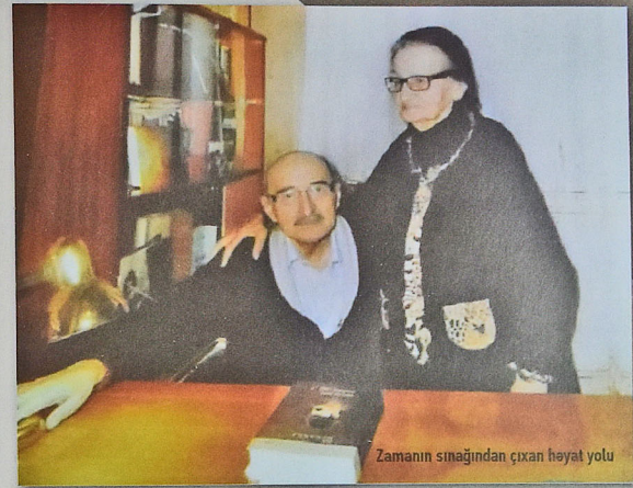
Zamanın sınağından çıxan həyat yolu

- Məsələ bir az başqa cürdür, doğrudan da, mətbuatda belə məlumat gedib, amma Tibb Universitetindən çıxması müəllim kobudluğu yox, ölüyərme prosesi ilə bağlıdır. Əslində həkimlik peşəsinə dayısı Niyazinin arzusu ilə yönəlmiş, Nəriman Nərimanov adına Azərbaycan Dövlət Tibb Universitetinə qəbul olunmuşdu. Lakin autopsiya əməliyyatından sonra orada çox davam edə bilməyəcəyini anlayıb. Gəlib ozamankı ADU-nun filologiya fakültəsinə... Həmin