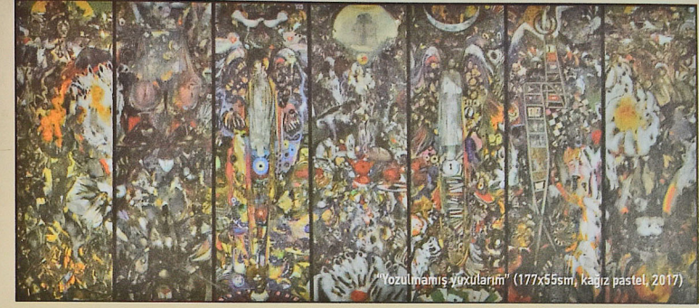
"Yozulmamış yuxularım" (177x55sm, kağız pastel, 2017)

Digər gözəl poliptix nümunəsi "Yozulmamış yuxularım" (177x55sm, kağız pastel, 2017) isə yeddi hissədən ibarətdir. Özlüyündə çox dərin həyat fəlsəfəsini əks etdirən bu əsərin ərsəyə gəlməsi üçün rəssam böyük əmək sərf edib. Burada tək bacarıq deyil, həm də böyük savad və dərin düşüncə gərəkdir. Bütün bəşəriyyətin başlanğıc nöqtəsi olduqları üçün tam mərkəzdə yuxarı hissədə Adəm və Havva təsvir edilib. Bu tabloda da opal daşının özündə əks etdirdiyi rənglərdən istifadə olunub. Tək bu dünya ilə kifayətlənməyən rəssam axirət dünyasını, cənnəti, cəhənnəmi də təsvir edib. Burada müxtəlif inanclardan gələn simvollar, ürayın mahiyyətinin əksi və sair verilib. Kompozisiyada insanlıq üçün vacib olan elmə də geniş