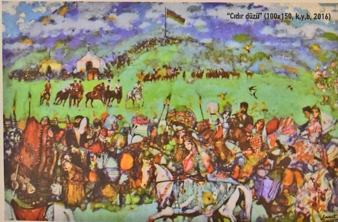
"Cıdır düzü" (100x150, k,y,b, 2016)

Rəssam Sakit Məmmədovun Azərbaycan xalqının adət-ənənəsini və tarixini özündə əks etdirən əsərləri içərisində "Cıdır düzü" (100x150, k,y,b, 2016) xüsusi yer tutur. Əzəli Azərbaycan torpağı, indi isə Ermənistanın işğalına məruz qalan Şuşa şəhəri yaxınlığında yerləşən bu gözəl ərazi rəssamın tabloları arasında olmaya bilməzdi. "Cıdır düzü" istər rəng həlli, istərsə də kompozisiya quruluşuna görə çox dərin mənalar daşıyır. Sol küncdə milli musiqi alətimiz olan tar və Qarabağ xalçası təsvir olunub. Əsər başdan-baş "Azərbaycan xalqının tarixini və mədəniyyətini özündə əks etdirən tablo" adlandırıla bilər. Əsərə baxarkən öz adı ilə dünyaya səs salmış Qarabağ atını, milli musiqimizin şahı olan muğamı, arxa hissədə dədə-babalarımızın oynadığı çövkən oyununu, bəzi döyüş səhnələrini və ən sonunda dağın yuxarısına sancılmış Azərbaycan bayrağını görürük. Rəssam bayrağı ən yüksəkdə