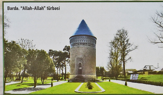
Barda. "Allah-Allah" türbəsi

Tarix və mədəniyyət qoruqlarında, turizm məqsədləri üçün istifadə edilən abidələrdə müvafiq infrastrukturun yaradılması sektorun inkişafı baxımından xüsusi aktualıq kəsb edir. Bu gün Azərbaycanda turizmin əsas infrastrukturunu qurulub, yeni hotellər istifadəyə verilib, keyfiyyətli xidmətin təşkili, kadr hazırlığı, turizm imkanlarımızın tə-