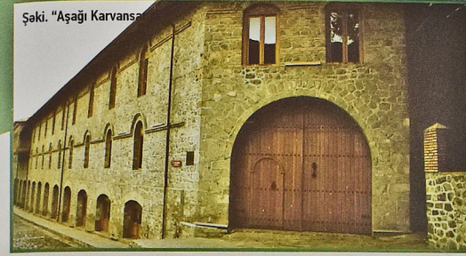
Şaki. "Aşağı Karvansaray"

Azərbaycanda çoxlu tarix-mədəniyyət abidələri varsa da, onların hamısının turizm xidmətləri göstərməyə hazır olduğunu deyə bilmərik. Bu sahədə dünya təcrübəsi mövcuddur. Arxeoloji və digər abidələr, sadəcə, abidə kimi qalsın, turist üçün elə də maraqlı kəsb etməyəcək. Ancaq bu, turistin başa düşə biləcəyi bir vəziyyətə gətirilsə, yol infrastrukturunu qurulsun, həmin abidənin yerləşdiyi ərazidə turistlərin dincəlməsi, ayləncəsi üçün şərait yaradılsın, o, əsl turizm obyektinə çevriləcək.