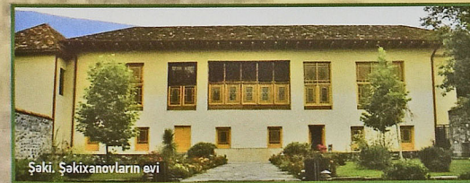
Şaki. Şəhaxanovların evi

Nazirlər Kabinetinin qərarı ilə daşınmaz tarix və mədəniyyət