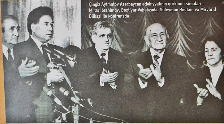
Çingiz Aytmatov Azərbaycan ədəbiyyatının görkəmli simaları – Mirzə İbrahimov, Bəxtiyar Vahabzadə, Süleyman Rüstəm və Mirvarid Dilbazi ilə konfransda

Yazıçı ən adi həyat hadisələrini belə global səviyyəyə qaldırmağı, ona ən yüksək fikir zirvəsindən baxmağı bacaran sənətkardır. Təxvil etdiyi böyük hadisələrin özünü deyil, fəlsəfəsini, mahiyyətini görür və göstərir. Zəngin və bəşəri yaradıcılığı türkdilli xalqların ortaq mədəni dəyərləri və qədim söz xəzinəsi üzərində ucalan sənət zirvəsi, dünya ədəbiyyatına ulu türk sözünün qiymətli töhfəsidir. Bəli, Aytmatov təkcə qırğız ədəbiyyatını zirvələrə qaldırmamış, həm də türkdilli ədəbiyyatı şərəfləndirmiş, dünyaya ədəbiyyatının, bəşəri ideyaların yüksək bədii təəcəssümü