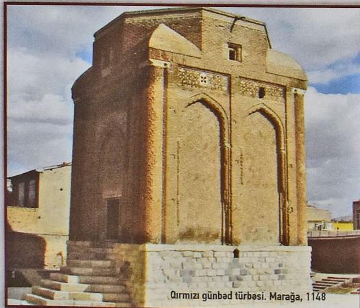
Qırmızı günbəz türbəsi. Marağa, 1148