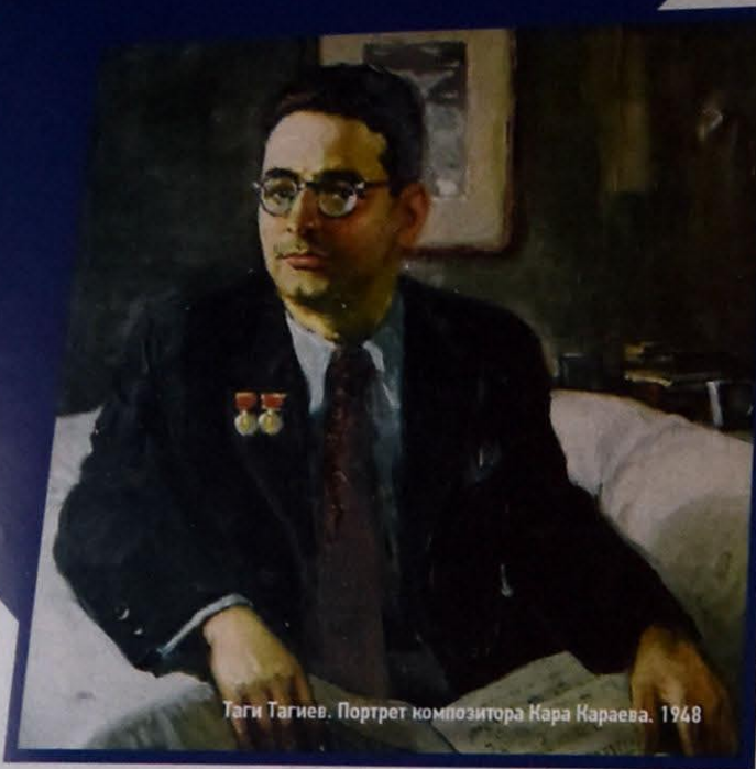
Таги Тагиев. Портрет композитора Кара Караева. 1948

ство, такая безграничная, в сущности, способность к тончайшему психологическому анализу и одновременно – к созданию эмоциональной атмосферы коллективного, массового, объединяющего”