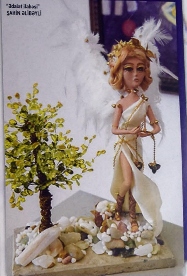
"Ədalət ilahəsi" ŞAHİN ƏLİBƏYLİ

lüyü (400 ədəd) buna şərait yaradıb. Əlbəttə, kəmiyyət kiçik, əhəmiyyətsiz amil deyil. Amma keyfiyyətin önəminin yanında ən böyük kəmiyyət belə nüfuzsuz olur. 32 Gürcüstan rəssamının 300 və tanınmış kuklaçılarımızla bərabər, Dilərə Atakışiyevanın rəhbərlik etdiyi "D`Art" studiyasının iştirakçılarını təmsil edən 20 Azərbaycan rəssamının 100 ədəd əsərindən ibarət "Mələyin qanadları altında" adlı kukla sərgisi ilayrici ərəfəsində, başqa sözlə, hər kəsin fərqli təəssüratlar intizarında olduğu zaman kəsiyində əsl möcüzə bayramı müjdəçisinə çevrildi. Başər tarixində kuklanın özünün ayrıca tarixi var. O sanki hər zaman insanın yanında olmağa can atıb, ya da bu istək qarşılıqlı olub – sakral yükün teatr elementi, daha sonra əyləncə vasitəsi və nəhayət müəllif kuklası olaraq yüksək sənət nümunəsi kimi zəngin yol keçən kuklalar bütün təyinatlarında diqqət mərkəzində olublar. Haqqında bəhs etdiyimiz sərgi kukla sənətinin bütün mərhələlərinin layiqli ehtivası idi desək, yanlışdır. Dekabrın 15-dən 30-dək kukla yaradıcılığı paytaxtımızda sanki parada çıxmışdı – "Mələyin qanadları altında" adlı sərgi məhz belə təəssürat doğurdu. Həqiqətən də, bu sərgini müəllif kuklası sərgiləri sırasında ən parlaqlarından biri hesab etmək olar – burdakı 400 əsərin istisnasız olaraq hər biri – bədii kuklalar, suvenirilər, oyuncaqlar, marionetlər, etnoqrafik kuklalar