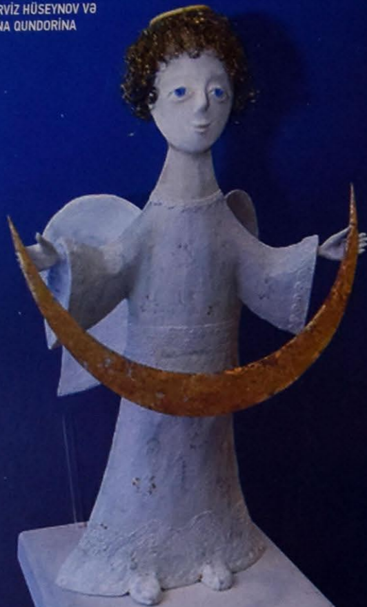
"Aytutan" PƏRVİZ HÜSEYNOV VƏ İRİNA QUNDORİNA