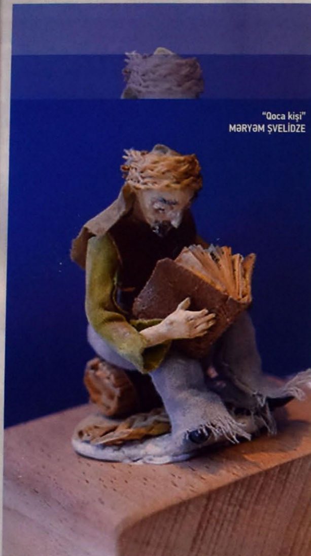
"Qoca kişi" MƏRYƏM ŞVELİDZE