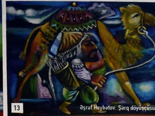
Əşraf Heybətov. Şərq döyüşçüsü

Key words: Azerbaijan, modern painting, grotesque, artistic exaggeration, artistic method, phantasmagoria, stylization, artistic montage.