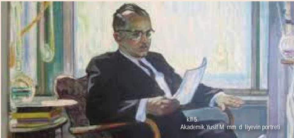
ki 5. Akademik Yusif Mammadliyev portreti

yetirsək, tamaşaçının gözü qarşısında tamamilə fərqli ikonografik kompozisiyanın təsvirini görə bilərik. İmpressionistlərin texnikasından bəhrələnən Mikayıl Abdullayev mənzərə önündə düşüncəli, lirik pəhrəmanını əks etdirib. Obrazdakı geyim xırda, dəqiq detallarla işlənmişdir. Mənzərənin bir tərəfində Şamaxı, digər tərəfində Hələb şəhərinin təsviri rəssamın dünyagörüşü, Nəsiminin doğulduğu və vəfat etdiyi şəhərlərin simvolik əksi kimi qeyd olunmalıdır. Kompozisiyada dumanlı və günəşli tonların digər simvolikasını da duymaq mümkündür.