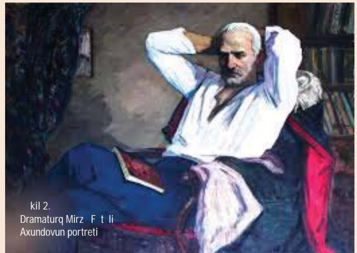
kil 2. Dramaturq Mirzə Fətəli Axundovun portreti

nümunələrinin təsviri tarixi qadın obrazımıza yeni ifadəlilik verir. Rəssamın “Natəvan balaca Üzeyiri məktəbə yola salır” süjetli əsərində məkan və obrazlar qarşılıqlı əlaqədədir. Arxa fonda kənd mənzərəsi, ön planda milli geyimləri ilə seçilən kəndlilər görünür. Əsərdə Natəvanın mimika və jestlərlə əksi, balaca Üzeyirin məktəbə sevinclə