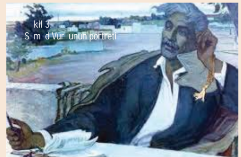
kil 3. Səməd Vurğunun portreti

Mikayıl Abdullayev yaradıcılığında Xalq şairi Səməd Vurğunun portretləri də xüsusi yer tutur. Şairin gənclik çağından ömrünün sonlarına qədər portretləri rəssam tərəfindən yaradılıb. 1959-cu