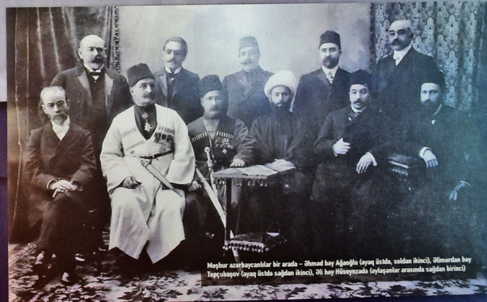
Məşhur azərbaycanlılar bir arada - Əhməd bəy Ağaoglu (solaqda ikinci), Əhməddən bəy Topçubaşov (solaqda üçüncü), Əli bəy Hüseynzadə (solaqda dördüncü)

Əhməd bəy 1915-ci ildə İstanbulda yarıdılan “Rusiya Türk-Tatar Müsəlmanlarının Hüquqlarının Müdafiəsi üzrə Komitə”yə daxil olub. Əhməd bəy bu dövrdə soyadının sonluğuna əlaqəli dəyişiklik edib.