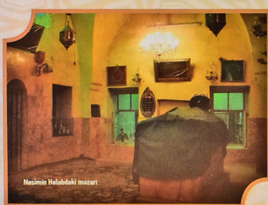
Nasiminin Haləbəliki məzarı

Vali olması və aqibatının digər valilər tərəfindən xəbar verilməsi