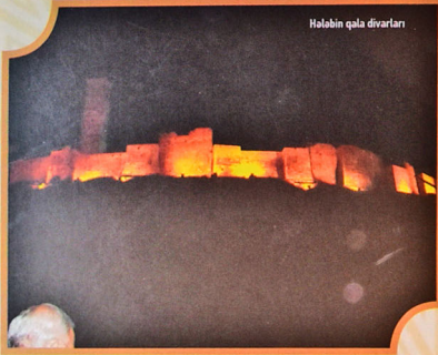
Halabın qala divarları

Əndalibin "Risaleyi-Nasimi"sində valiliyin əlamətlərindən biri kimi nəfəsi ilə ocaq yandırmaq göstərilir. Nasimi də nəfəsi ilə od olmadan odunları yandırır və müəllimi ağzından çıxan nəfəsin möcüzəsinə görə ona Nasimi təxəllüsünü verir. Beləliklə də, o, atas və külək kultunun eyni zamanda daşıyıcısı kimi təqdim olunur. Maraqlıdır ki, əlavə-bəktəşi çevrələrində həm övluya olaraq Nasimi, həm də "övluyalar sarvarı" (Qul Nəsimi) adlandırılan hz. Əli nəsimlə, sahar mehi ilə əlaqələndirilir. Əlavə-bəktəşi ədəbiyyatının məşhur nümayəndələrindən Pir Sultan (XVI) deyir: