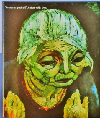
Anasim portreti. Ketan, yağı boya