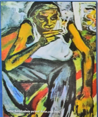
Sattar Bəhlulzadənin portreti. Ketan, yağı boya