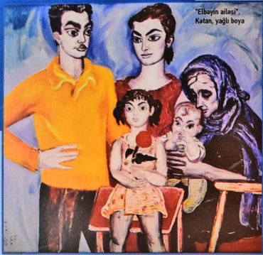
"Elbəyin ailəsi". Katan, yağlı boya

aparan "Yatmış Əsmər" tablosunda balaca qızın obrazı xaliyabənzər, rəngarəng bağcanın mərkəzində yerləşdirilib. Bu isə öz növbəsində saflığı və bərkəti simvolizə edir. Bu gözəl bağça nağıllar aləmində olduğu kimi sanki yuxuya getmiş qızın keşiyində dayanıb. Bu da biza əsas verir ki, uşağı mühafizə edən bağcanı rəssam atanın fantastik obrazı kimi qiymətləndirək.