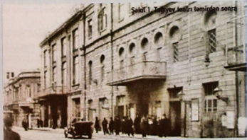
Səhifə 1. Tağıyev teatrindən sonra