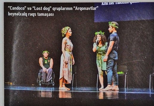
"Candoco" və "Lost dog" qruplarının "Arqonavtlar" beynəlxalq rəqs tamaşası

Festivalın bütün tədbirlərindən bir söhbətdə bəhs etmək qeyri-mümkündür, amma daha bir neçəsinin adını çəkmək istərdim: Xalq artisti Nəzakət Teymurovanın Nəsiminin şeirlərinə bəstələnmiş əsərlərdən ibarət "Qəlb aynası" adlı xüsusi konsert proqramı, Kanadadan Par B.L.EUX assosiasiyasının üzvü olan "Klara Furey" müasir rəqs qrupunun ifasında dərin konseptual məzmunlu "Kosmik sevgi" adlı balet tamaşası, İsraildən olan ərəb musiqisini müasir aranjimanda ifa edən "Dudu Tassa & Kuwaitis" musiqi qrupu, türkiyəli rəssam Ahmet Güneştekinin Heydər Əliyev Mərkəzindəki "Yaddaş əlifbası" adlı fərdi sərğisi. Gördüyünüz kimi, çox tədbirlərin elə adını çəkməklə kifayətlənməli oluruq, çünki həm festivalın proqramı olduqca dolğun idi, həm də hər bir tədbirin xüsusi tarixçəsi, mənası, proqrama salınmasının dərin səbəbi var... Nəsimi Festivalı əvvəlcədən belə düşünülüb ki, öz daxilində bir neçə ayrı-ayrılıqda əhəmiyyət kəsb edən layihələri (festival, art-simpozium, müsabiqə) də ehtiva etsin. Belə ki, Qala qəsəbəsinin müxtəlif nöqtələrində keçirilən 4-cü "Daşın nağməsi" Beynəlxalq həykəltərəşliq simpoziumu, 8-ci "Tullantıdan incəsənətə" yenidən emal sənəti üzrə Beynəlxalq art-simpozium, "Danışan divarlar" Beynəlxalq urban art layihəsi dünyanın dörd bir yanından təsviri sənət ustalarını Bakıda əsərlərini yaradıb nümayiş etmək üçün toplamışdır. Paytaxtımızda IRCICA – İslam Tarixi, Mədəniyyəti və İncəsənəti Araşdırma Mərkəzi ilə əməkdaşlıqda bu