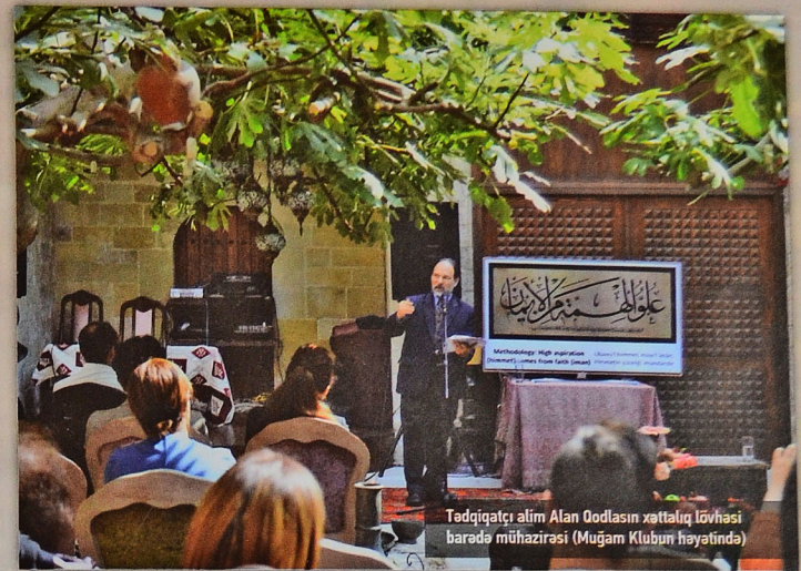
Tədqiqatçı alim Alan Qodlasın xəttatlıq lövhəsi barədə müəhazirəsi (Muğam Klubun həyatında)

il ilk dəfə keçirilən "El Sənəti" Bakı Beynəlxalq Ənanəvi Sənətkarlıq Festivalı "İçərişəhər" Dövlət Tarix-Memarlıq Qoruyucu İdarəsi tərəfindən Nəsimi Festivalı günlərinə təsadüf edilməsini təklif etmişdir. Festival günlərində KiçikGəlArt qalereyasında "Moving verses" (Hərəkətli/təsirli şeirlər) adlı xüsusi seçilmiş beynəlxalq video art proqramı nümayiş olunurdu, festivalda bir neçə ay əvvəl elan olunmuş iki müsabiqə isə Nəsimi poeziyasından ilhamlanan yaradıcı əsərlərin meydana gəlməsinə nəzərdə tutuldu – Azərbaycan Xalça Muzeyinin bilavasitə təşkil etdiyi xalça eskizi müsabiqəsi və Mədəniyyət Nazirliyinin "SÖZ" layihəsi tərəfindən həyata keçirilən poeziya əsərləri müsabiqəsi.