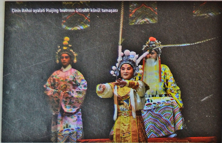
Çinin Anhui əyaləti Huijing teatrının iztirablı könül tamaşası

Bu fərqli-fərqli elementləri üzvi surətdə uzlaşdırmaq, hər birinin işində də yeni, eksperimental ünsürlər sınamaq riski var idi. Bir misal gətirirəm: Şərq musiqi mədəniyyəti indi ayrı-ayrı milli musiqi mədəniyyətlərinə bölünmüşdür, lakin tarixi mənbələrdən məlumudur ki, qədim dövrlərdə müxtəlif ölkə və bölgələrdən qaynaqlanan musiqi üslubları və nümunələri arasında fəal mübadilə mövcud imiş. Bizim bir neçə ölkənin musiqiçilərini bir layihədə birləşdirməkdə məqsədimiz həmin itirilmiş əlaqələri, qırılmış telləri bərpa edərək yeni musiqi yaradıcılığı təzahürlərini üzə çıxarmaq idi. Beləliklə,