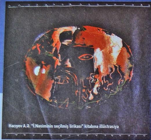
Hacıyev A.Ə. "İ.Nəsiminin seçilmiş lirikası" kitabına illüstrasiya