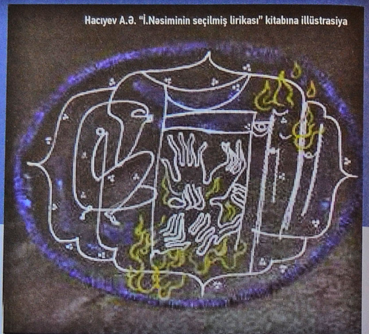
Hacıyev A.Ə. "İ.Nəsiminin seçilmiş lirikası" kitabına illüstrasiya

E.Şaxtaxtinskaya bu silsilədən olan əsərlər yaratmaqla həm də ölkəsinin milli mənəvi dəyərlərinə saygısını, öz qədim mədəniyyətinə sahib çıxdığını, özünün vətəndaşlıq mövqeyini bir daha göstərmişdir. Digər tərəfdən isə bu əsərlər – Azərbaycanın qədim mədəniyyət abidələrinin, elm, ədəbiyyat və incəsənət xadimlərinin təsvirləri ölkəmizin minilliklərlə formalaşmış zəngin mədəniyyətinin dünyaya tanıtılmasında misilsiz qaynaqlardır. Belə əsərlərdən biri də Nəsiminin 600 illik yubileyinə həsr olunmuş plakatdır. Rəssamın bu silsiləyə daxil olan plakat əsərləri bir-birini tamamlayır və eyni zamanda hər biri ayrı-ayrılıqda müstəqil əsərlərdir. Onlara nəzər saldıqda Azərbaycanın dünya mədəniyyətinə bəxş etdiyi görkəmli şəxsiyyətlərin cəlbedici, yüksək bədii-estetik məziyyətə malik, son