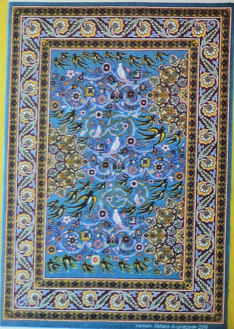
1 yer Xalça "Nəsimi yeli". Azərbaycan. 2019 Ərişi, arğacı: pambıq, xovu: yun. Xovlu toxunuşu, al işi. 100,5x146 sm Müəllif: Fatimə Axundzadə

2019-cu ildə böyük şair və mütəfəkkirimiz İmadəddin Nəsiminin 650 illik yubileyi qeyd olunur – Azərbaycanda "Nəsimi ili" elan olunmuş, cənab Prezident İlham Əliyev tərəfindən isə müvafiq tədbirlərin keçirilməsinə dair sərəncam imzalanmışdır. Bu sərəncam ölkəmizin mədəni həyatında çox əlamətdar və təqdirəlayiq hadisə, dövlətimizin ədəbiyyata, incəsənət və mədəniyyətimizə verdiyi böyük dəyər və qayğının daha bir nümunəsidir.