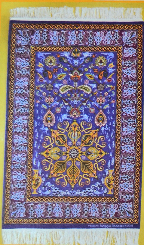
İl yer Xalça "Məndə siğar iki cahan, mən bu cahana siğmazam". Azərbaycan, 2019. Ərişi, arğacı: pambiq, xovu: yun. Xovlu toxunuşlu, əl işi. 100.5x152.5 sm Müəllif: Rühəngiz Bağirova

fonda, qara işə ağ fonda təsvir olunmaqla "iki cahanın" vəhdətini əks etdirir.