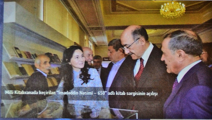
Milli Kitabxanada keçirilən "İmadəddin Nəsimi – 650" adlı kitab sərgisinin açılışı

Bu ekspozisiyalar həmin ölkələrdən beynəlxalq kitab mübadiləsi yolu ilə alınan kitablarla və digər materiallarla daim