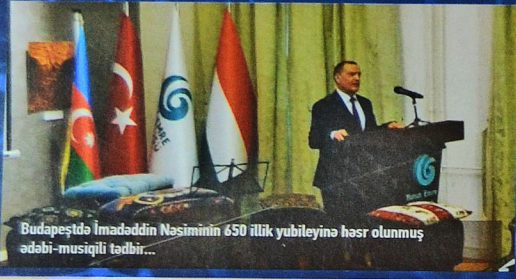
Budapeştdə İmadəddin Nəsiminin 650 illik yubileyinə həsr olunmuş ədəbi-musiqili tədbir...