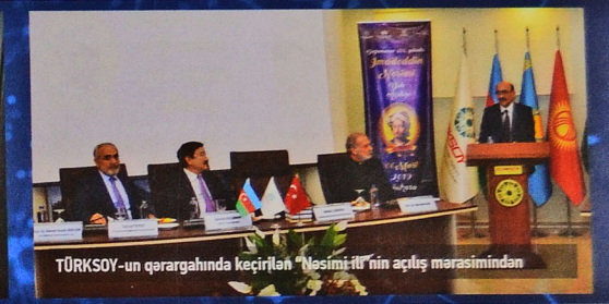
TÜRKSOY-un qərarında keçirilən “Nəsimi ili”nin açılış mərasimindən

Klassik və müasir Azərbaycan ədəbiyyatının görkəmli nümayəndələrinin yubileylərinin qeyd olunması və bu məqsədlə həm respublikamızda, həm də xarici ölkələrdə irimiqyaslı tədbirlərin təşkili artıq bir ənənə halı alıb. Görkəmli şəxsiyyətlərin yubileylərinin dövlət səviyyəsində keçirilməsi barədə Azərbaycan Respublikası Prezidentinin hər il bir neçə sərəncam imzalaması isə bu tədbirlərin daha yüksək səviyyədə reallaşmasına hərtərəfli imkanlar açır. Hətta hər ilin bir görkəmli şəxsiyyətə həsr olunması ənənəsi də geniş vüsət almışdır ki, son vaxtlar Molla Pənah Vaqif, İmadəddin Nəsimi düşünməsinə münasibətdə bunun ayəni nümunələrini görürük.