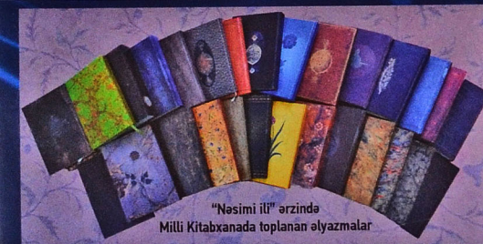
“Nəsimi ili” ərzində Milli Kitabxanada toplanan əlyazmalar