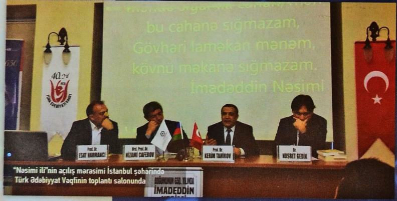
"Nəsimi ili"nin açılış mərasimi İstanbul şəhərində Türk Ədəbiyyat Vəqfinin toplantı salonunda

Azərbaycanın Birinci vitse-prezidenti Mehriban xanım Əliyevanın milli mənəvi dəyərlərimizin ölkəyə qaytarılması istiqamətində həyata keçirdiyi layihələrin məntiqi davamı saydığını vurğuladı. Bu nüsxələrin bütöv bir xəzinə olduğunu qeyd edən Leyla xanım onların tədqiqatçı alimlərimiz tərəfindən atraflı öyrəniləcəyinə və əsasında yeni-yeni elmi əsərlərin meydana gələcəyinə inandığını söylədi.