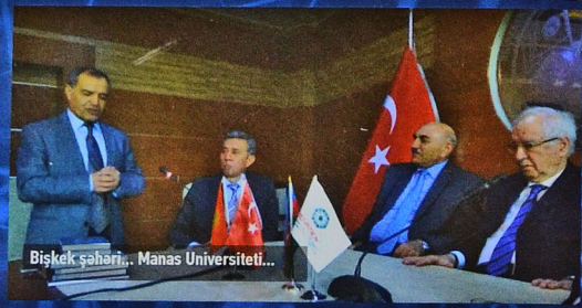
Bişkek şəhəri... Manas Universiteti...

şəhərində baş tutmuşdur. Aprelin 24-də dövlətimizin başçısının “Böyük Azərbaycan şairi İmadəddin Nəsiminin 650 illik yubileyinin keçirilməsi haqqında” 15 noyabr 2018-ci il tarixli sərəncamına müvafiq olaraq Azərbaycan Respublikası Nazirlər Kabinetinin 15 yanvar 2019-cu il tarixli 38s nömrəli sərəncamının icrası məqsədilə Azərbaycanın Mədəniyyət Nazirliyi, Macarıstandakı Səfirliyimiz, Azərbaycan Milli Kitabxanası və Budapeştdəki Yunus Əmrə İnstitutu ilə birlikdə Budapeştdə İmadəddin Nəsimiyə həsr olunmuş ədəbi-musiqili tədbir keçirildi. Tədbir Yunus Əmrə İnstitutunun