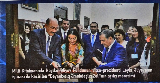
Milli Kitabxanada Heydər Əliyev Fondunun vitse-prezidenti Leyla Əliyevanın iştirakı ilə keçirilən “Beynəlxalq Əməkdaşlıq Zalı”nın açılış mərasimi