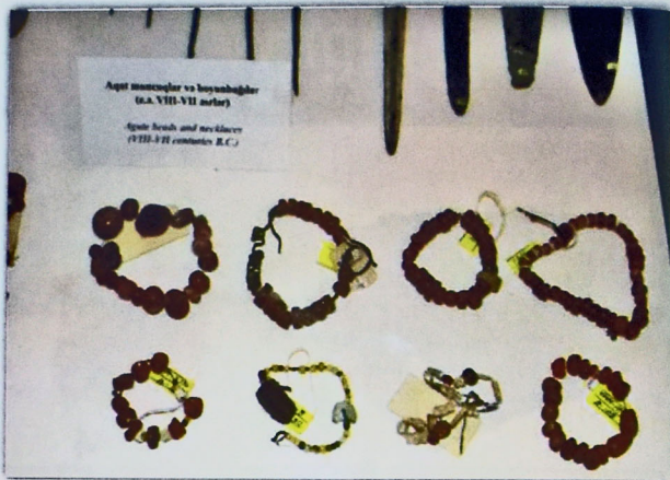
e.ə. VIII-VII əsərə aid aqat muncuqlar və boyunbağlar.

Zəngin mədəni irsə malik qədim Naxçıvan zərgərlik məmulatı ilə də kifayət qədər məşhur idi. Hələ eramızdan əvvəl II minillikdə əcdadlarımız tuncdan xəncərlər, kəmərlər, boyunbağlar, sırğalar və s. zinət əşyaları düzəltdirmişlər [5]. Buna bəriz nümunə kimi Azərbaycanın digər şəhərlərindən, eləcə də Naxçıvandan aşkarlanan maddi mədəniyyət nümunələrini göstərmək mümkündür. Tarixi qədim köklərə gedib çıxan zərgərlik sənətinə aid nümunələr Naxçıvanda I Kültapə yaşayış yerindən əldə olunub. Buradan qızıl məftildən hazırlanmış sırğa, tuncdan spiralvari girdə asmalar, bilərziklər, müxtəlif formalı tunc sırğalar və s. tapılıb. Naxçıvanda Son Tunc – Erkən Dəmir dövrünə aid arxeoloji abidələrdə bəzək əşyaları var [6]. Belə ki, bu bəzək əşyaları muncuqlardan, boyunbağıdan, asmalardan və s. ibarətdir. Bütün bu arxeoloji araşdırmaların nəticələri göstərir ki, bəzək əşyaları qədimdən insanların marağında idi. Azərbaycanın bir çox şəhərlərində olduğu kimi, orta əsrlərdə Naxçıvan zərgərliyi də öz mövqeyini qoruyub saxlayırdı. Ümumiyyətlə, orta əsrlər zərgərliyinin ən zəngin dövrlərindən biridir desək, yanlışdır. Həqiqətən də, orta əsrlərə məxsus Naxçıvan zərgərlik məmulatı diqqəti cəlb etməyə bilməz. ♦