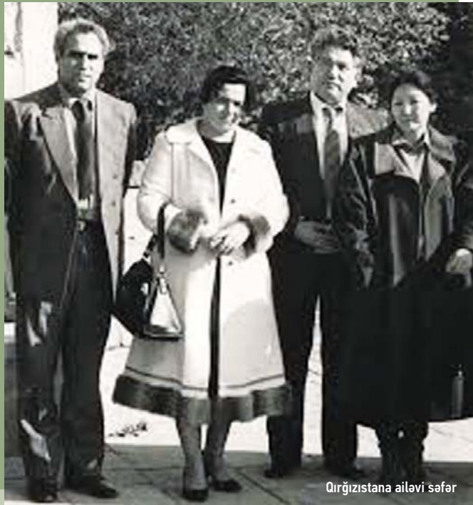
Qırğızistana ailəvi səfər