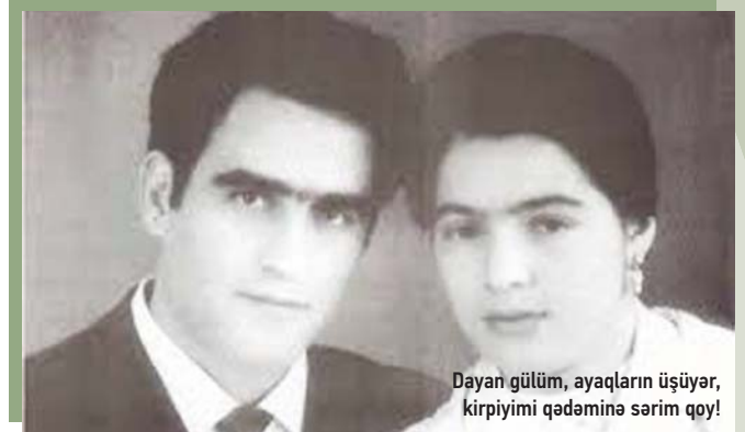
Dayan gülm, ayaqların üşüyər, kirpiyimi qədəminə sərilmə qoy!