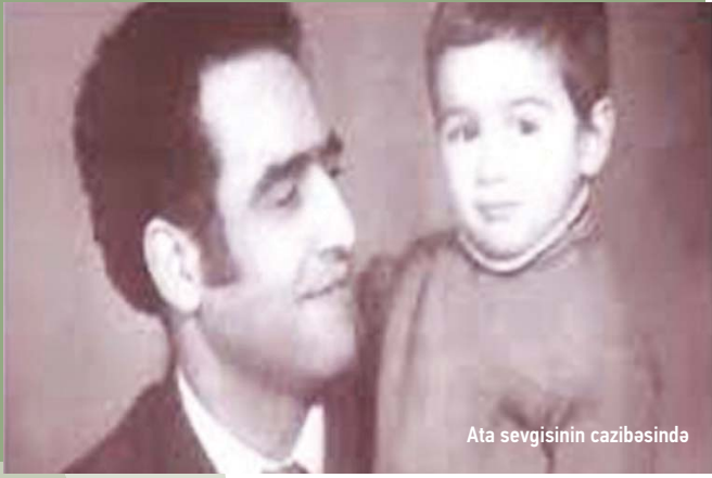
Ata sevgisinin cazibəsində