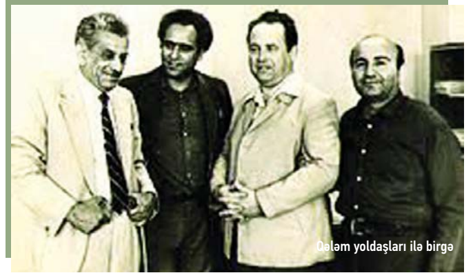
Ələm yoldaşları ilə birgə

Lənətlədiyi bəzi məqamların kökü isə şübhəsiz ki, keçmişlərə gedib çıxır. Yəni dövrün, indinin ağrı-acıları, qopmaları, pərakəndəliyi önündə tarix cavabdehdir, günahkardır; göstərilən səbəbdən həm tarixdəki, həm də tarixi ədalətsizliklərlə savaşıq, regional güclərə, dünya