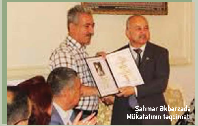
Şahmar Əkbərzadə Mükafatının təqdimatı

Ünlü şairimizin vəfatında sonra isə "Vektor", Şahmar Əkbərzadə adına Beynəlxalq Ədəbiyyat Mükafatı təsis elədi. 2001-ci ildən etibarən ənənəvi şəkildə hər il laureatlar - görkəmli xarici ölkə şairi və Azərbaycan şairi, yaxud ədəbiyyatşünası Mükafat Komissiyası