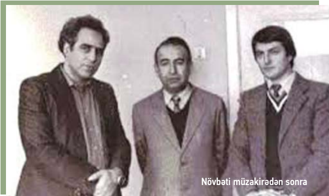
Növbəti müzakirədən sonra

Hayanda ləngidi oğul-uşağın?.. Kəsdə qış qapını qarlı, yağışla. Ürayim doluydu, əlim aşığı, Nə paltə, nə çəkmə aldım, bağışla, Üşüyürsənmi, ana?!