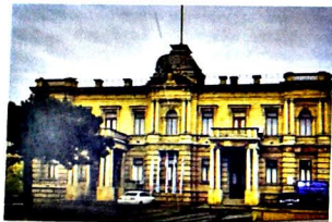
"MƏDƏNİYYƏT/CULTURE" - WWW.MEDENIYYET.INFO

Bu yaz bir başqa yaz oldu. Təassüf ki, belə poetik ifadə indiki halda təmənən başqa anlama yükənlənib. Dünya gözələrimizin öndüsündə yeni sima, fərqli səciyyə qazanmışdır. Son aylar dünyanın düzünən dəyişməsi bəşəriyyətin ən ağır sınaq dövrlərindən biri kimi tarixə yazıldı. Amma dünya nə qədər yenilənsə, nə qədər dəyişsə, nə qədər başqalaşsa da əbədi dəyər olan ədəbiyyat və incəsənət anlaşılanın dayaqları, ona münasibəti dəyişə bilməz. Əlbəttə, zaman-zaman dəyişikliklər baş verə bilər. Bu zaman kəsinəyində bir daha təsdiqləndi ki, ədəbiyyat və incəsənət hər hansı siyasi-iqtisadi proseslərin fəvqında dayanar əbədi varlıqlardır, daimi dəyərlərdir. Bəşər tarixinin üçüncü pandemiyası şəraitində muzeylər, teatrın, kitabxanaların, konsert müəssisələrinin insanların psixoloji durumunun dayanağı olmasına təsir əsərdi. Və belə mürəkkəb dövrdə respublikamızın xalq-hakimiyyət birtiriyinin, qarşılığı inamının, vaxtda doğru-dürüst qərar vermək və o qərarın ədi vətəndaşın vətəni yüksək rütbəli mürəkkəb yerinə yetirmək məsuliyyətinin demək olar ki, tam dolğun nümunəsinin daha bir təsdiqindən məmnunluq.