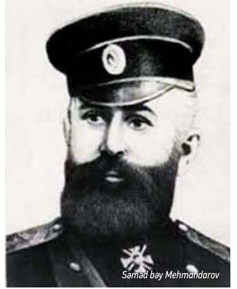
Səməd bəy Mehmandarov

S.Mehmandarov ordunu bolşeviklərin zərərli təbliğatından qorumağa çalışır, bununla əlaqədar Nazirlər Şurasının sədri, eyni zamanda Daxili işlər naziri N.Yusifbəyli məlumatlandırır: “tərəfindən belə bir məlumat alınıb ki, Bakıda müsəlmanlardan ibarət xeyli bolşevik təmayüllü şəxs hər vasitə ilə kazarmalara daxil olmağa, təbliğatla ordunun əsaslarını sarsıtmağa və bolşevik ideyalarını aşılamağa can atırlar. Bakıda yerləşən qoşunlar, xüsusilə piyada qoşunları hərbi tərbiyənin əsaslarını tamamilə mənimsəmişlər və intizam o qədər də möhkəm deyil, buna görə də mən qoşunları Bakıya gətirmək istəmədim. Bu gənc qoşunları bolşeviklərin dağıdıcı təbliğatından qorumaq üçün Zati-Əlilərinizdən kazarmaların yerləşdiyi rayonlara kənar şəxslərin icazəsiz daxil olmasına imkan verilməməsi məqsədi ilə qoşunların yerləşdiyi rayonlarda polis nəzarətinin tətbiqinə sərəncam verməyinizi xahiş edirəm...”