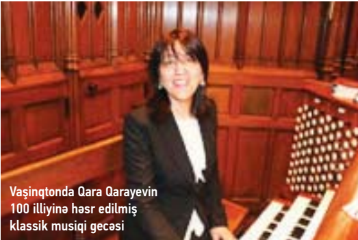
Vaşinqonda Qara Qarayevin 100 illiyinə həsr edilmiş klassik musiqi gecəsi

keçirmək üçün vahid platforma haqqında düşünməyə başladım. 2018-ci ilin yanvarında yaradılan "Azərbaycan-Amerika Musiqi Fondu" adlı qeyri-hökumət təşkilatının həmtəsisçilərindən biri və icracı direktoruyam.