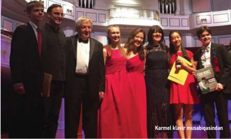
Karmel klavir müsabiqəsindən