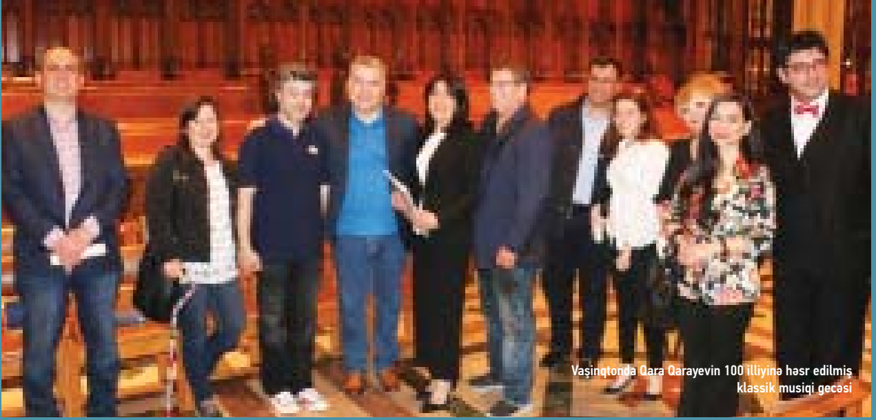
Vaşinqonda Qara Qarayevin 100 illiyinə həsr edilmiş klassik musiqi gecəsi