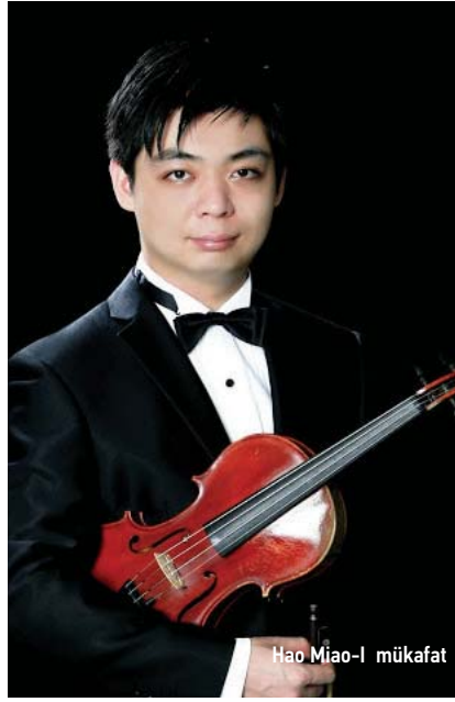
Hao Miao-I mükafat