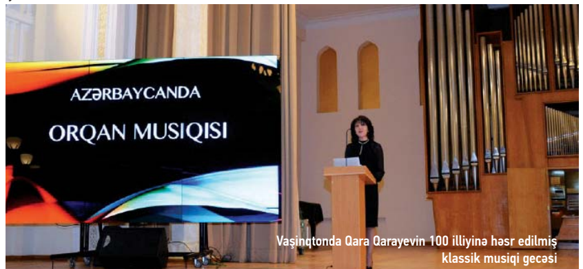
Vařinqonda Qara Qarayevin 100 illiyinə h sr edilmiş klassik musiqi gecəsi

Diskd  15 prel d, "Tsarskoye selo heyk li", "Don Kixot" simfonik qrav rl ri, "İldırımlı yollarla" baletindən "Laylay" v  "Ehtiraslı qızın r qsi", "Yeddi g z l" baletindən vals -  mumilikd  23 musiqi n munəsi yer alıb. Layih nin t dqimatı  .Hacıb yli adına BMA-da 2017-ci ilin fevral ayının 7-d  bař tutdu.