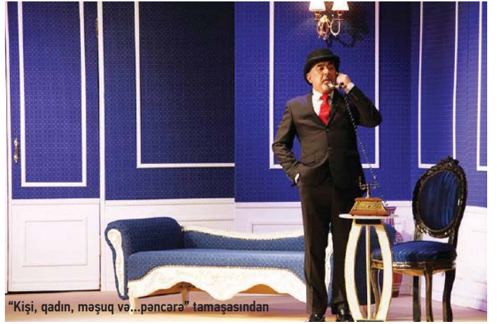
"Kişi, qadın, məşuq və...pəncərə" tamaşasından

Teatr bu ilin dekabrında 100 illik yubileyini keçirməyə hazırlaşır. Yubiley hazırlıqları hələ ki onlayn şəraitdə gedir. Yubiley münasibətilə teatrın Rusiyanın bir neçə şəhərinə qastrolu və Moskva və Sankt-Peterburq teatrlarının Bakıya səfəri nəzərdə tutulub. Kollektiv o əhvala köklənib ki, teatr canlı orqanizmdir və onun fəaliyyətinin dayanmasına imkan vermək olmaz.