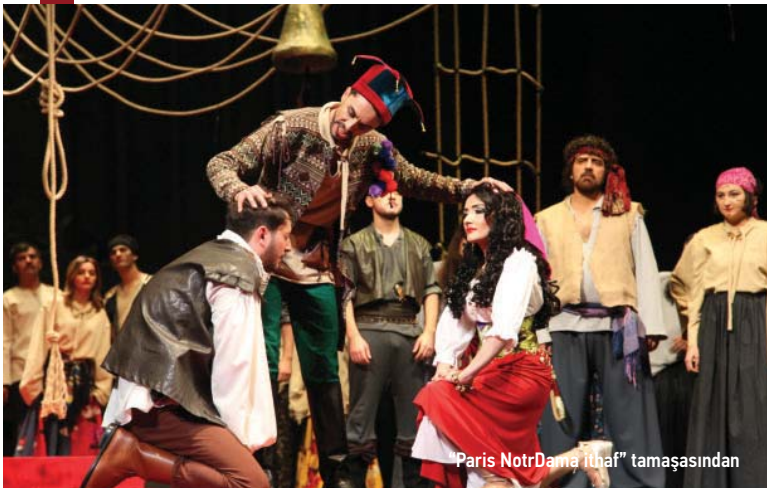
"Paris Notrdamə itfahı" tamaşasından