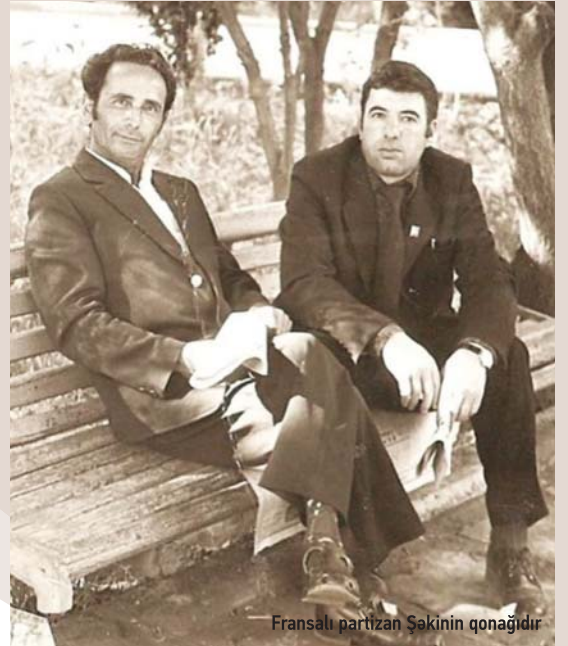
Fransalı partizan Şakinin qonağıdır

süngüdən keçirirlər, evdə oturub belə dəhşətlərə səssiz, seyrci qala bilmərəm, mən də atam kimi qəhrəman olacağam” deyirdi.