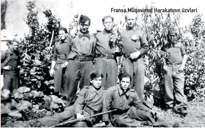
Fransa Müqavimət Hərəkatının üzvləri