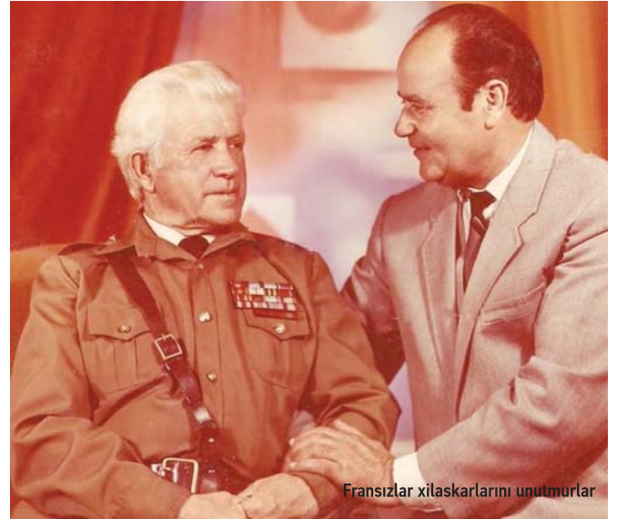
Fransızlar xilaskarlarını unuturlar