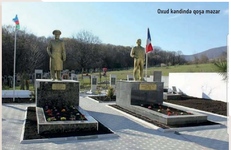
Oxud kəndində qoşa məzar