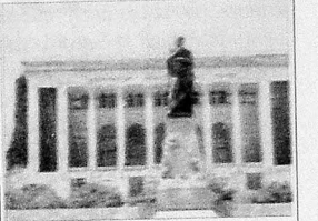
Milli Dram Teatrı