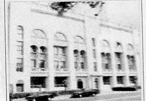
Musiqili Komediya Teatrı