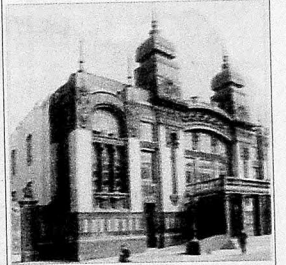
Opera və Balet Teatrı