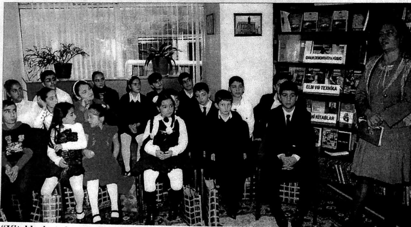
"Kitabla dost ol, ən fəal oxucu ol!" müsabiqəsi