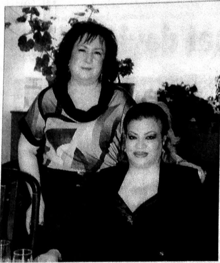
Xalq artisti Afaq Bəşirqızı ilə görüntü

lər, bayramlar, yubileylər müxtəlif tədbirlərlə qeyd olunmuşdur.