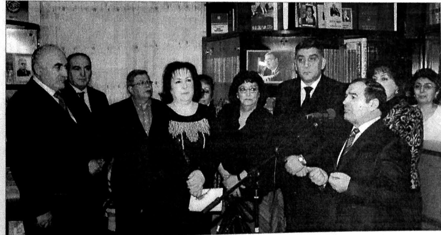
İnformasiya Mərkəzinin açılış zamanı

Azərbaycan Respublikasının Prezidenti İlham Əliyevin 6 fevral 2009-cu il tarixli sərəncamına əsasən Azərbaycanın Xalq yazıçısı Mehdi Hüseynin anadan olmasının 100 illik yubileyinin qeyd edilməsi respublikanın mədəni həyatında baş verən mühüm hadisələrdən biridir. 2009-cu il iyulun 7-də yazıçının yubileyi münasibətilə M. Qorki adına MSKF-də ədəbi-bədii gecə keçirildi. Gecədə ədəbiyyat, teatr xadimləri, musiqiçilər,