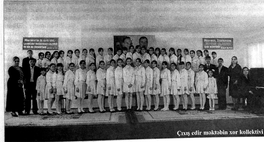
Çıxış edir məktəbin xor kollektivi

Gənclər və İdman Nazirliyinin təşkilatçılığı ilə keçirilən uşaq folklor müsabiqəsində isə "Çilgün nağaraçılar" ansamblımız ikinci yeri tutdu.