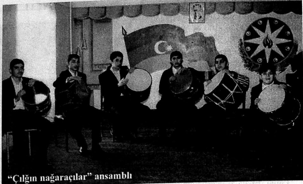
“Çılğın nağaraçılar” ansamblı

Belə ki, "2009- 2013-cü illər üçün Azərbaycan Respublikasında uşaq musiqi, incəsənət və rəs-samlıq məktəblərinin fəaliyyətinin yaxşılaşdırıl-ması üzrə İnkişaf Proqramı"na uyğun olaraq 2013-cü ildə Şirvanda yeni bir musiqi məktəbinin tikin-tisinə başlanılmışdır.