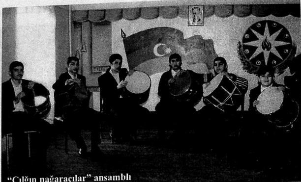
“Çalğın nağaraçılar” ansambli

Belə ki, "2009-2013-cü illər üçün Azərbaycan Respublikasında uşaq musiqi, incəsənət və rəsəmsənət məktəblərinin fəaliyyətinin yaxşılaşdırılması üzrə İnkişaf Proqramı"na uyğun olaraq 2013-cü ildə Şirvanda yeni bir musiqi məktəbinin tikintisinə başlanılmışdır.