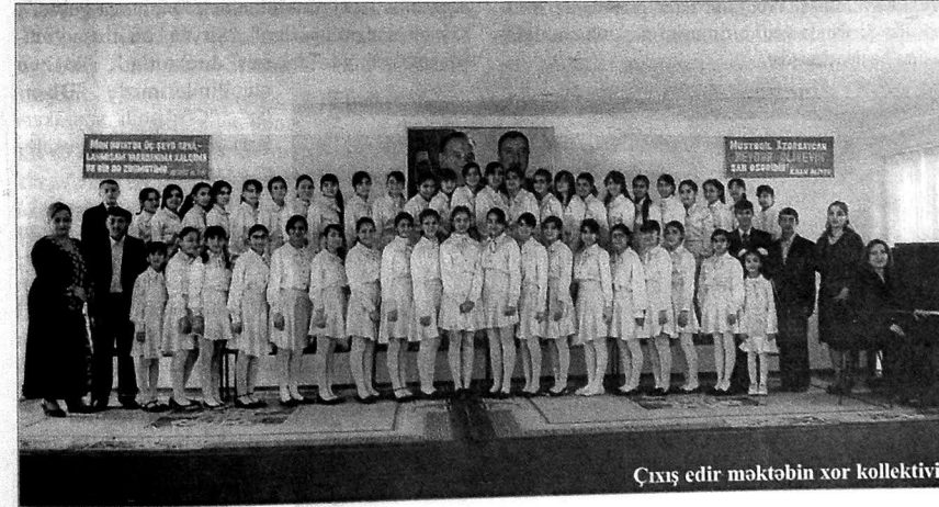
Çilgün edir məktəbin xor kollektivi

Gənclər və İdman Nazirliyinin təşkilatçılığı ilə keçirilən uşaq folklor müsabiqəsində isə "Çilgün nağaraçılar" ansamblımız ikinci yeri tutdu.