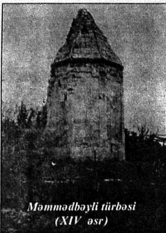
Məmmədbəyli türbəsi (XIV əsr)

Zəngilan rayonu dəqiq əraziyə malik olan bir inzibati vahidlik kimi 8 avqust 1930-cu ildən mövcud olmuşdur. Zəngilan Azərbaycan Respublikasının inzibati rayonudur. Qərbdən və şimal-qərbdən tərəfdən bədnam qonşularımız olan Ermənistanla, cənub və cənub-qərbdən isə İran İslam Respublikası ilə həm-